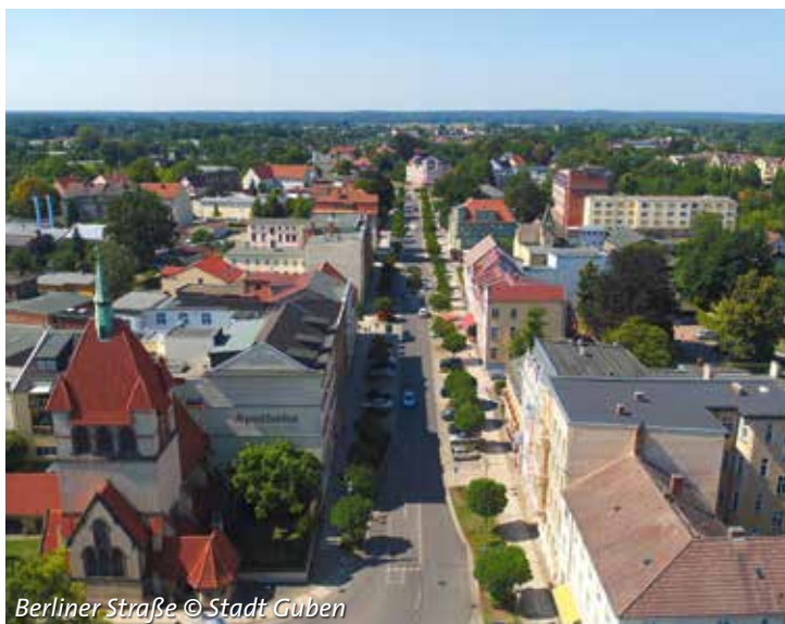
Berliner Straße