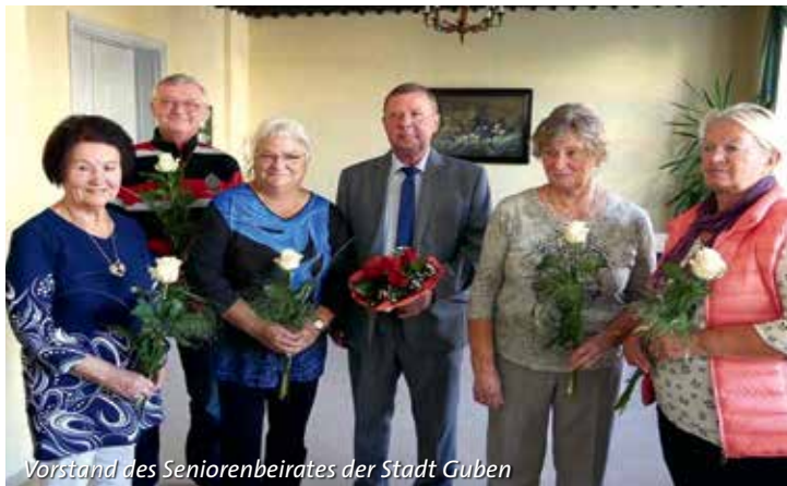
Vorstand des Seniorenbeirates der Stadt Guben

Montag: 08.00 – 16.00 Uhr Dienstag: 08.00 – 18.00 Uhr Mittwoch: 08.00 – 14.00 Uhr Donnerstag: 08.00 – 18.00 Uhr Freitag: 08.00 – 14.00 Uhr Samstag: 09.00 – 12.00 Uhr (gerade Kalenderwoche)