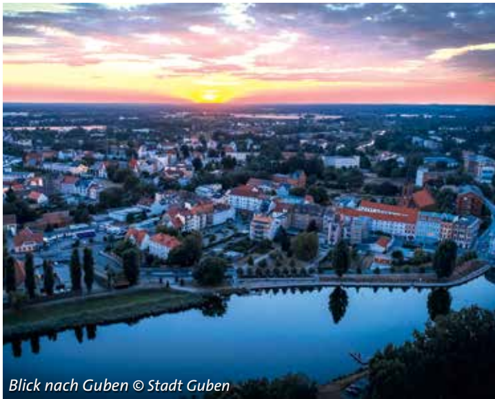
Blick nach Guben