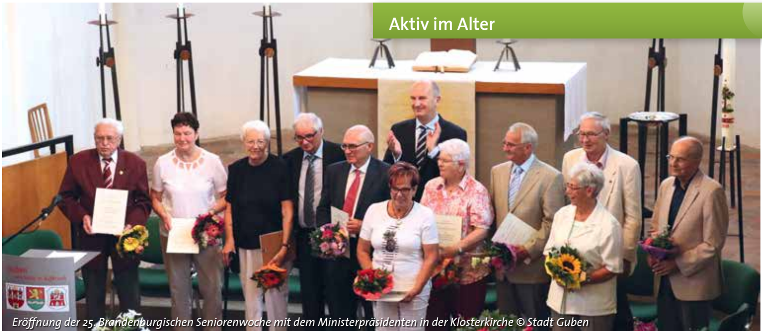
Eröffnung der 25. Brandenburgischen Seniorenwoche mit dem Ministerpräsidenten in der Klosterkirche