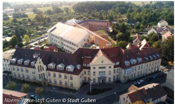
Naëmi-Wilke-Stift Guben