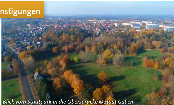
Blick vom Stadtpark in die Obersprucke

Die Ausgestaltung der Patientenverfügung sollte mit einem Arzt/Hausarzt besprochen und von diesem unterschrieben werden.