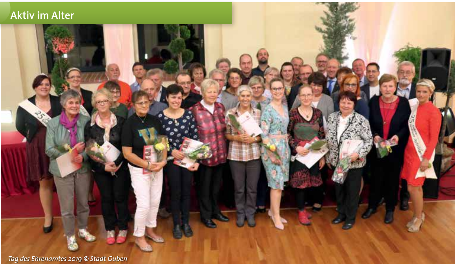
Tag des Ehrenamtes 2019