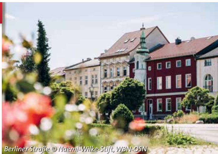
Berliner Straße

2020 wurden 1.000 Senior*innen zum Geburtstag bzw. den Ehepaaren zu besonderen Ehejubiläen anlässlich der Goldenen, Diamantenen und Eisernen Hochzeiten gratuliert.