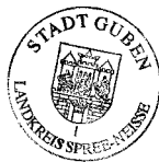
Stadt Guben Der Bürgermeister