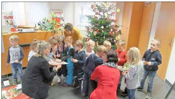
Ein Dank von der Sparkasse an die „Hasenkinder“.

Guben, 17.12.2018: Anfang Dezember begann sie wieder die Vorweihnachtszeit und mit ihr die Freude der Kinder mit dem Warten auf das Christkind.