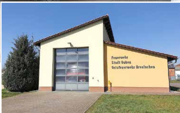
Gerätehaus der Ortsfeuerwehr Bresinchen