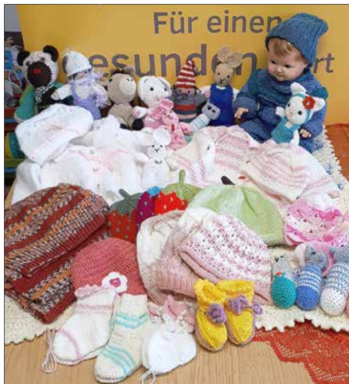
Wunderschöne Handarbeiten für das Netzwerk Gesunde Kinder