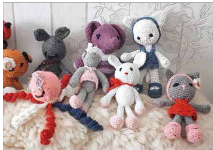
Handarbeiten der Strickgruppe vom „Netzwerk Gesunde Kinder“

Pressestelle Landkreis Spree-Neiße/Wokrejs Sprjewja-Nysa