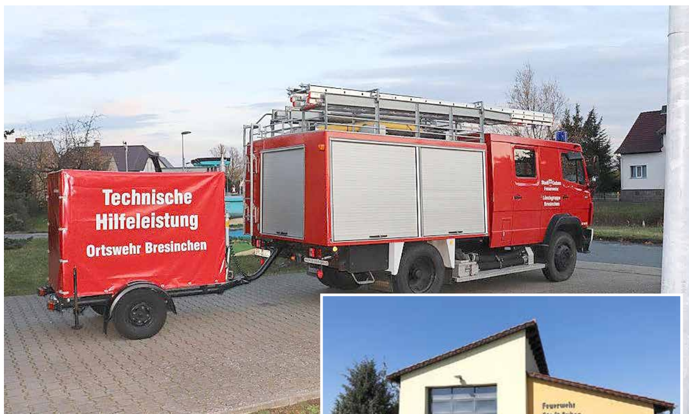
Löschgruppenfahrzeug LF 16 TS mit Anhänger für Technische Hilfeleistungen.