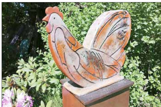
Das Keramikwerk „Huhn“. Fotograf: Manfred Wenck

Das Stadt- und Industriemuseum präsentiert ab dem 2. Juli 2021 eine neue Sonderausstellung unter dem Titel „Gestern und Heute“ vom Groß Drewitzer Keramikünstler und Maler Manfred Wenck. Seit über 30 Jahren arbeitet der gebürtige Ostpreuße als freiberuflicher Baukeramiker und gestaltete seitdem zahlreiche repräsentative Keramikwerke wie Brunnen, Stelen, Leuchtoobjekte, Tierfiguren oder auch außergewöhnliche Pflanzgefäße für den öffentlichen Raum. In dieser Zeit hat er sich mit seinen repräsentativen Arbeiten insbesondere im Raum Frankfurt (Oder) und Neuzelle einen Namen gemacht. Der ehemalige Farbgestalter und Designer widmet sich seit einigen Jahren auch intensiv der Malerei. Als Maltechniken verwendet er Pastell, Aquarell und Acryl.