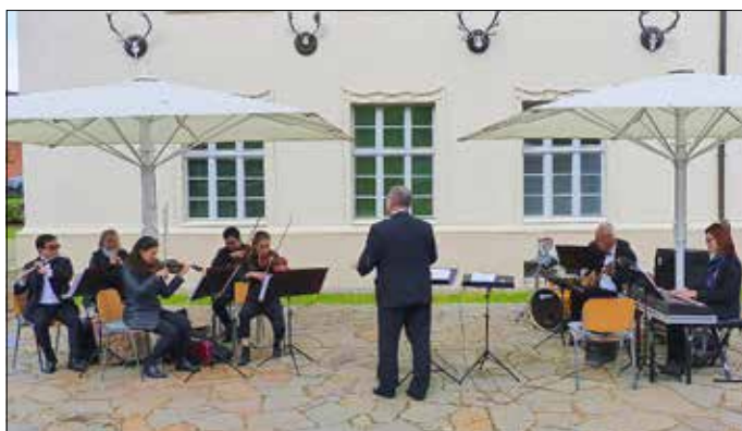
Klassik Open Air im Jagdschloss Schorfheide.

In diesem Jahr lädt die Stadt Guben am Samstag, 3. Juli 2021, um 17 Uhr zu einem großen „Klassik Open Air“ im Außenbereich des Jugendbegegnungszentrums, Mittelstraße 18 (ehem. Fabrik e. V.), ein. Zu Gast ist das Brandenburgische Konzertorchester Eberswalde unter der musikalischen Leitung von Urs-Michael Theus, der kenntnisreich und mit viel Humor durch den Abend führen wird. Mit Sicherheit werden Sie den einen oder anderen Song wiedererkennen, denn das Programm zeigt die musikalische Bandbreite und Vielfältigkeit des Eberswalder Ensembles mit schwingvollen Melodien aus Oper, Operette, Musical und Film sowie modernen Popklängen. Stimmlichen Glanz verheißen an diesem Abend das Berliner Solistenpaar Esther Puzak (Sopran) und Brendan Sliger (Tenor), die mit viel Spielfreude das Publikum begeistern werden. Seien Sie dabei und genießen Sie einen lauschigen Sommerabend mit dem Brandenburgischen Konzertorchester Eberswalde. Bitte beachten Sie die aktuell geltenden Hygienemaßnahmen! Der Eintritt ist frei.