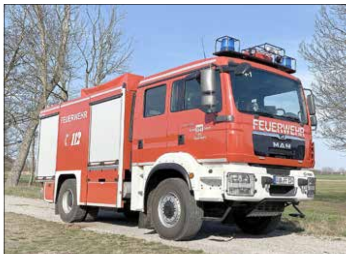
TLF 4000 mit einem Fassungsvermögen von 4.000 Liter.

Es war Anfang der 90er-Jahre, als die Freiwillige Feuerwehr Guben am Standort Mitte ihr erstes „Waldbrand“-Tanklöschfahrzeug (TLF 16/48) - Typ Brandenburg bekam. Das Fahrzeug vom Hersteller MAN wurde 1994 in Dienst gestellt. Der Waldbrand in Grieben im August 1994 war die erste Bewährungsprobe des neuen Fahrzeugs. Das geländegängige Fahrwerk, 4.800 Liter Löschwasser und eine leistungsfähige Pumpe bieten die besten Voraussetzungen für das Bekämpfen von Waldbränden. 3 Kameraden bilden die Besatzung. Für die alltäglichen Einsätze wird das Fahrzeug als Wasserzubringer bei Brandeinsätzen oder an der Wasserentnahmestelle eingesetzt.