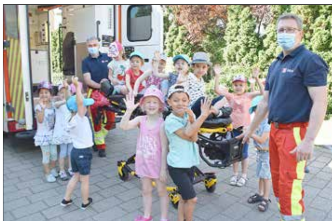
Die Kinder hatten ihren Spaß beim Erkunden des Rettungswagens.

Was für eine Aufregung! Am Dienstag, 8. Juni 2021, stand plötzlich ein Rettungswagen vor der Tür des Kindergartens im Naëmi-Wilke-Stift. Gut, das ist für die Kinder nicht unbedingt ein un-