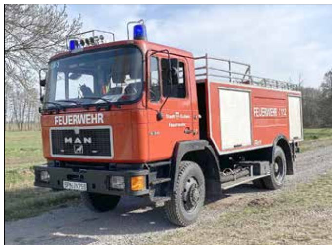
Waldbrand-Tanklöschfahrzeug TLF 16/48 mit 4.800 Liter Löschwasser.

Nach 25 Jahren und unzähligen Einsätzen wurde dieses Fahrzeug durch die neuste Generation abgelöst. Wobei das Wort „abgelöst“ trifft es nicht ganz, denn nach der Indienststellung