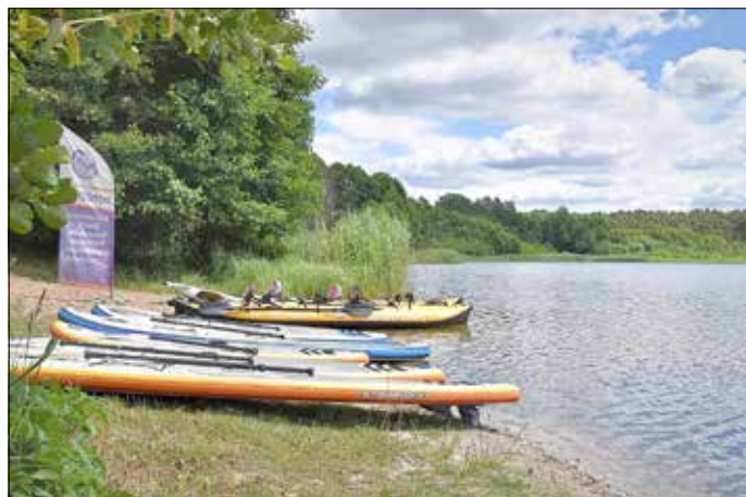
Erleben Sie die verschiedensten Wassersportmöglichkeiten am Großsee.

Am 17. Juli 2021 laden der Marketing und Tourismus Guben e. V., der Betreiber des „Waldcamping am Großsee“ und der Wassersportanbieter Exeditours an den Großsee zum Bade- und Sporterlebnis ein. Der Großsee, ein beliebtes Ausflugsziel und Erholungsort, wird von Einheimischen wie auch Auswärtigen gern besucht. Am 17. Juli 2021 können neben dem Badevergnügen direkt am Strand verschiedene Wassersportmöglichkeiten ausprobiert werden. Zur Auswahl für den Wassersport stehen beispielsweise Schlauchboot, Trekajaks oder Stand-up-Paddling. Für die gastronomische Versorgung findet der Gast verschiedene Stände im Beachfood-Bereich. Wer nicht auf oder in das Wasser möchte, kann am Nachmittag auch den Blick auf den See genießen oder wandert den Rundweg um den See. Die Initiatoren erwarten die Gäste zwischen 13:00 und 17:00 Uhr. Der Eintritt ist frei. Ein Teilnehmerbeitrag entsprechend dem Angebot ist zu entrichten. Der Wassersporttag findet unter Einhaltung der geltenden Abstands- und Hygieneregeln statt.