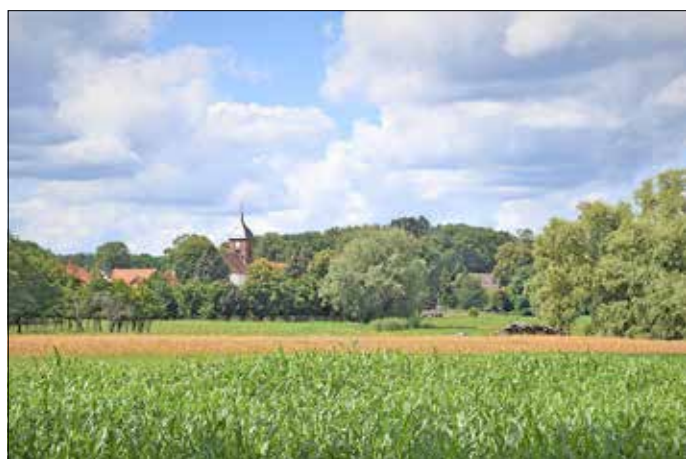
Blick in die Atterwascher Wiesen.

Am 10. Juli 2021 laden der Marketing und Tourismus Guben e. V. (MuT e. V.) und die Wanderführerin Gudrun Jordan zur Sommerwanderung ein. Diese Wanderung lässt eine Vielzahl von Gegensätzen erleben. Im Zusammenwirken bilden sie einen eng verzahnten Lebensraum für Pflanzen und Tiere. Einigen davon wird man begegnen, andere warten darauf, entdeckt und bewundert zu werden. Es wird ein erholsames Erlebnis, in diesem einzigartigen Flora-Fauna-Schutzgebiet unterwegs zu sein, zu beobachten und zu verstehen warum es ein besonderer Schatz unserer