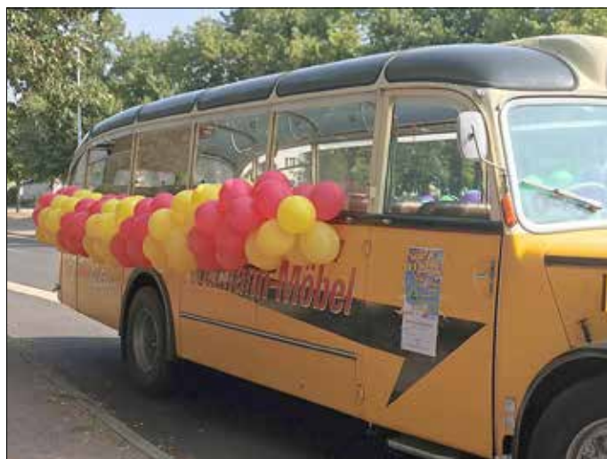
Oldtimerfahrten von Hoffmann Möbel