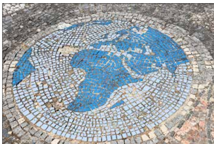
Fehlstellen im Mosaik