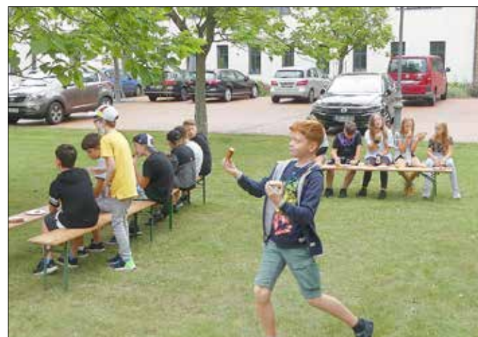
Grillen mit der Klasse 6a