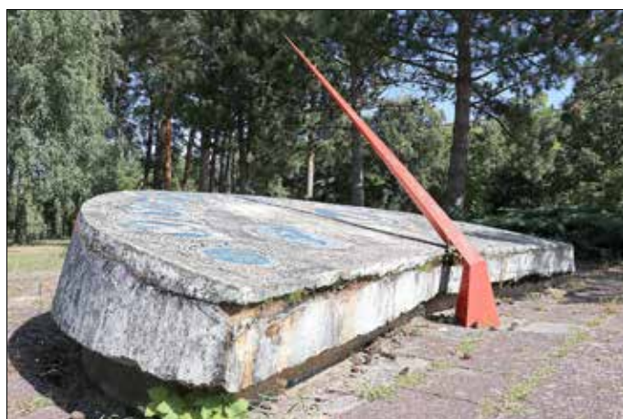
Risse im Sockel

Quellen: https://www.dressler-atelier.de/dieter-dressler/vita-dieter-dressler , Neißer Echo 23/2015 vom 20.11.2015