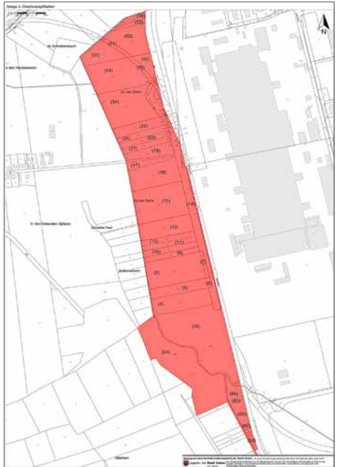
Anlage 3 zur SVV 043/2022

Stadt Guben Stabsstelle Wirtschaftsförderung/Stadtentwicklung