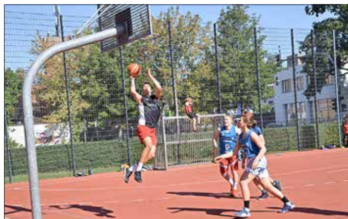
Basketballturnier in Cottbus.

Am 10. Juni 2022, ab 15:00 Uhr, Schulhof Pestalozzi-Gymnasium