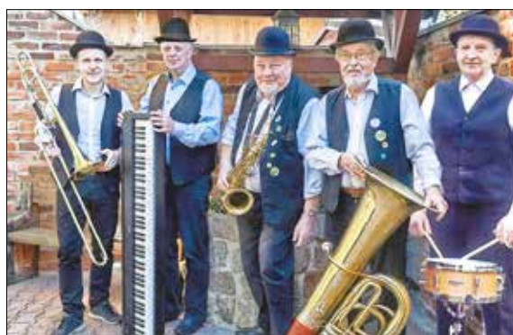
Die Cottbuser Dixieland Stompers bringen heitere volkstümliche Musik im New-Orleans-Stil der 20er-Jahre, die jedes Publikum begeistert - Sonntag, 12. Juni 2022, 14:00 Uhr, Hauptbühne.