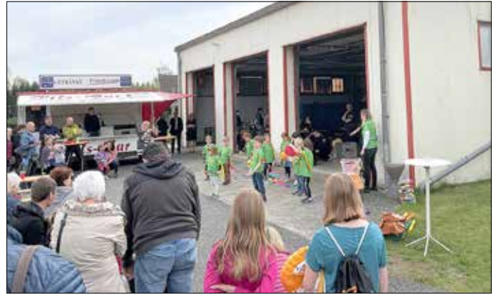
Vorfürungen der Kita Brummkreisel.