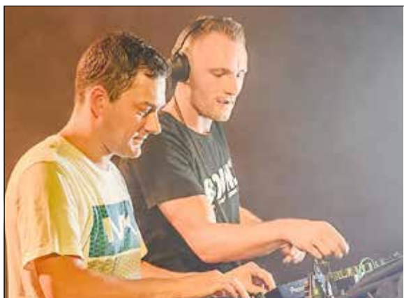
Die Stadt Guben präsentiert am Freitagabend, 10. Juni 2022, 22:30 Uhr das DJ Duo ELECTROSALAT auf der Hauptbühne. Die beiden Maximalbass-Spezialisten stürmen nicht nur die Lausitzer Clubs, sondern sind in ganz Ostdeutschland unterwegs.