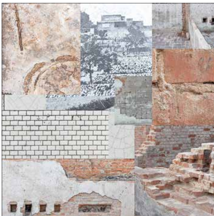
Collage Lars Wiedemann.

Seit dem 15. Mai 2022, dem Internationalen Museumstag, präsentieren wir am Standort des Stadt- und Industriemuseums die deutsch-polnische Sonderausstellung unter dem Titel: „Mies van der Rohe - Aufbruch in die Moderne in Guben/Gubin“. Es ist eine in Kooperation mit dem Berliner Fotografen Lars Wiedemann und unter Beteiligung des polnischen Vereins „Freunde des Gubiner Landes“ entstandene Sonderausstellung. Gefördert wurde diese von der Euroregion Spree-Neiße-Bober, unterstützt von der Sparkasse Spree-Neiße und dem Gubener Heimatbund e. V.