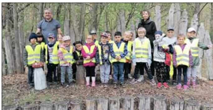
Die Kinder der Kita Musikspielhaus.

Die Mädchen und Jungen der Kita Musikspielhaus besuchten Anfang Mai die Waldschule Kleinsee. Eingebettet in einem gro-