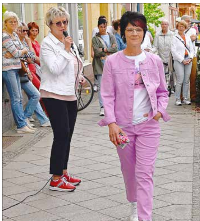
Die Frankfurter Straße wurde zum offenen Wohnzimmer mit vielen besonderen Shoppererlebnissen, wie z. B. die Modenschau von JANNETT-Textilien.