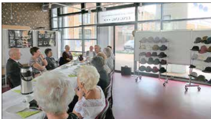
Bei Kaffee und Kuchen berichteten die ehemaligen Mitarbeiterinnen und Mitarbeiter der Hutfabrik über ihre Erlebnisse.

Am Sonntag, 8. Mai 2022, war es endlich so weit: Der Bürgermeister hatte im vergangenen Jahr gewettet, dass am Tag des Hutes 2021 nicht mehr als 20 ehemalige Hutmacherrinnen und Hutmacher anlässlich einer Ausstellungseröffnung erscheinen. Natürlich waren es mehr und der Wetteinsatz konnte am 8. Mai