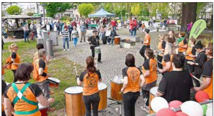
Als kleines Highlight brachte die Samba-Gruppe „los Krachos“ die Altstadt zum Beben.