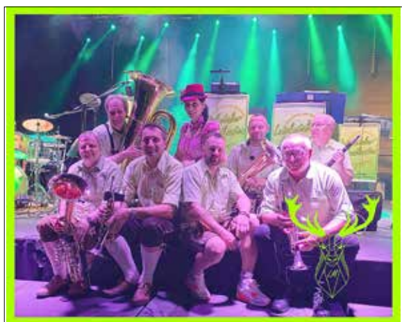
Die Lutzketaler Musikanten sind Samstag, 11. Juni 2022, ab 16:00 Uhr auf der Nebenbühne am Lohmühlenweg. Dann heißt es: Blasmusik in idyllischer Biergartenatmosphäre!