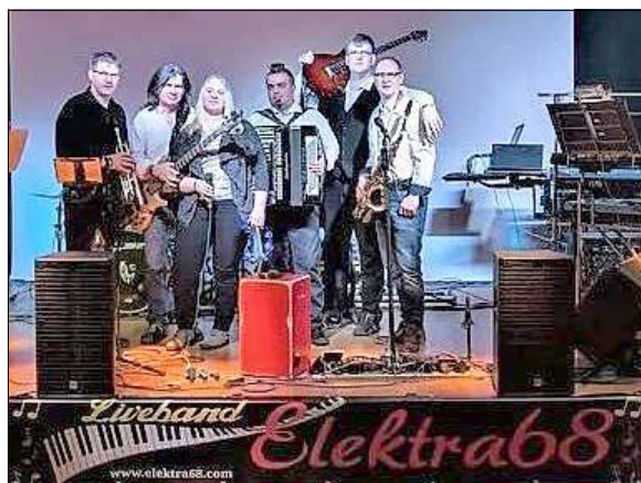
Elektra 68. Mit handgemachter Livemusik präsentieren sie Hits der letzten 50 Jahre und Songs aus den aktuellen Charts - Sonntag, 12. Juni 2022, 15:00 Uhr Nebenbühne/Lohmühlenweg.