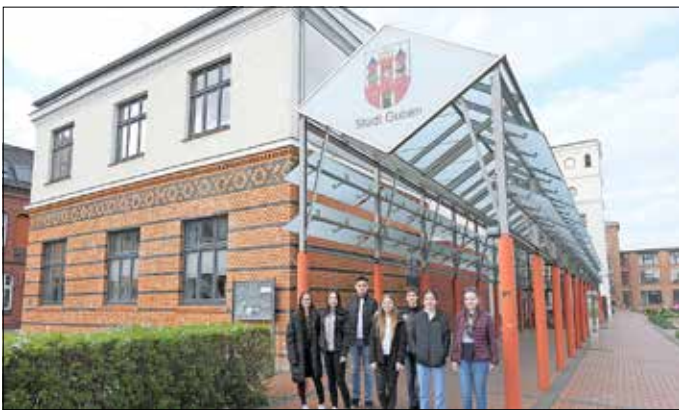
Für einen Probetag in der Stadtverwaltung Guben hatten sich sieben Jungen und Mädchen entschieden.

Am Zukunftstag, 28. April 2022, konnten Schülerinnen und Schüler ab der Jahrgangsstufe 7 im Land Brandenburg Berufe erkunden. Die Jugendlichen hatten die Möglichkeit vor Ort im Betrieb oder auch digital Berufe direkt auszuprobieren und ihren Traumberuf zu entdecken. Angesichts der demografischen Entwicklung ist das auch dringend nötig. Der Fachkräftemangel