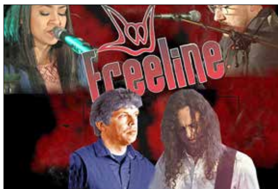
Freeline , die Oldie und Blues Rock Band aus dem Erzgebirge begeistert am Samstag, 11. Juni 2022, um 22:00 Uhr mit handgemachter Musik im Stile der alten Ikonen.