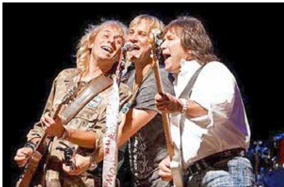
Spirit of Smokie beeindrucken am Samstag, 11. Juni 2022, um 20:00 Uhr auf der Hauptbühne mit ihrer Ähnlichkeit des „70er-Jahre Smokies“.