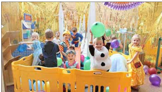
Kinder der Igelgruppe im „Luftballonbad“.

Der Fasching und das traditionelle Zampern mussten in diesem Jahr im Kindergarten des Naëmi-Wilke-Stiftes Corona-bedingt ausfallen, dafür feierten die Kinder Ende April ein fröhliches Kostümfest.