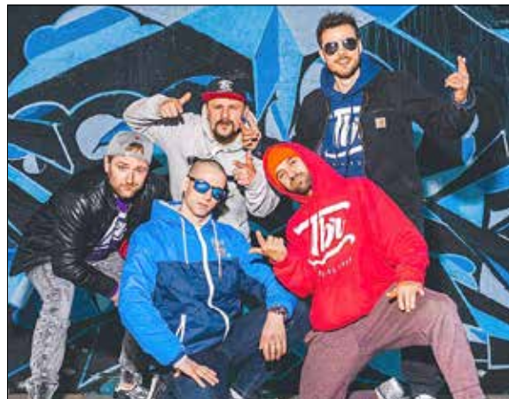
Frieden, Liebe, Einheit und Spaß - diese Slogans im Rhythmus von Hip-Hop und Breakdance stehen für die Tabasco Break Rebels . Am Freitag, 10. Juni 2022, ab 20:30 Uhr auf der Hauptbühne.