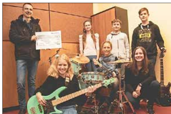
Erst im Sommer letzten Jahres formierte sich die junge Rockband „ The Peppermints “, sie überzeugen mit frischem Sound und lebendiger Spielfreude. Die Städtische Musikschule „Johann Crüger“ ist mit weiteren deutsch und polnischen Künstlerinnen sowie Künstlern auf der Bühne vertreten. Dazu zählen u. a. das Zupf-Streich-Orchester , die Tänzer , das Bläserorchester und das Klarinettenensemble der Musikschule, auch die Bläserklassen beider Gubener Grundschulen werden beim Frühlingsfest auftreten.