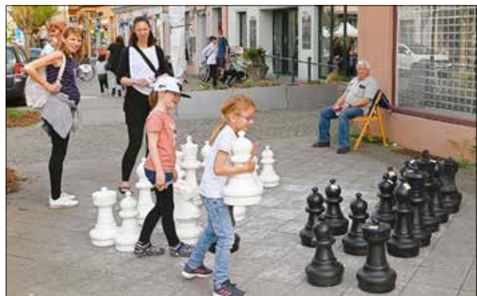
Parallel zum Europatag organisierten die Altstadt Händler am 7. Mai 2022 die Aktion „Stadt statt Stube – Einkaufen in Wohnzimmeratmosphäre“.