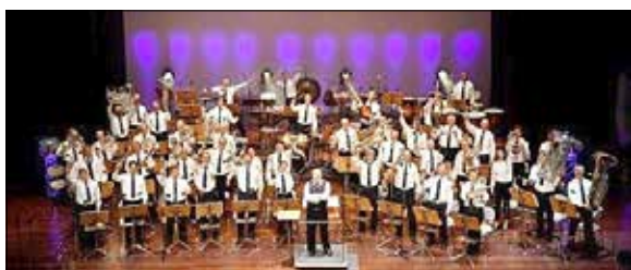
Die Combo des Landespolizeiorchesters bildet eine Auswahl an Künstlerinnen und Künstler, die das Frühlingsfest am Samsta, 11. Juni 2022, um 14:00 Uhr bereichern werden.