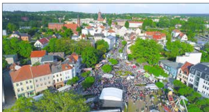
Frühling an der Neiße 2019.