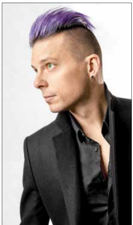
The Dark Tenor. Ob Klassikfan oder Rock-/Popkonzertgänger, The Dark Tenor ermöglicht den Zugang zu weltbekannten klassischen Themen mit der Attitüde aktueller Pop- und Rockmusik sowie dem Sound der Gegenwart. - Sonntag, 12. Juni 2022, 16:00 Uhr, Hauptbühne. © Billy Andrews