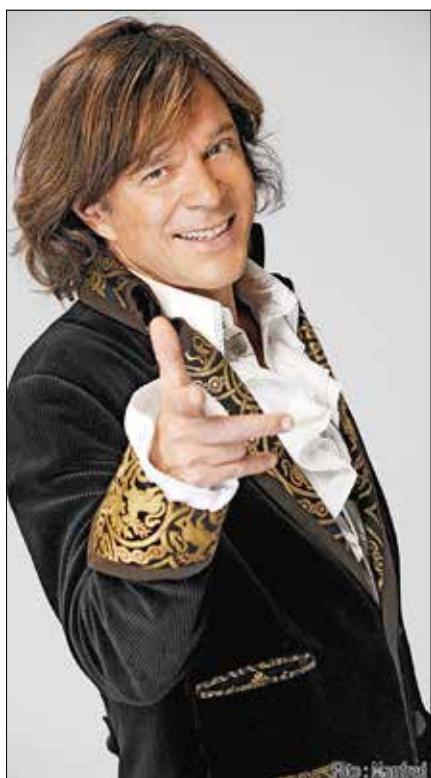
Stargast Jürgen Drews tritt am Sonntag, 12. Juni 2022 um 18:00 Uhr auf der Hauptbühne auf.