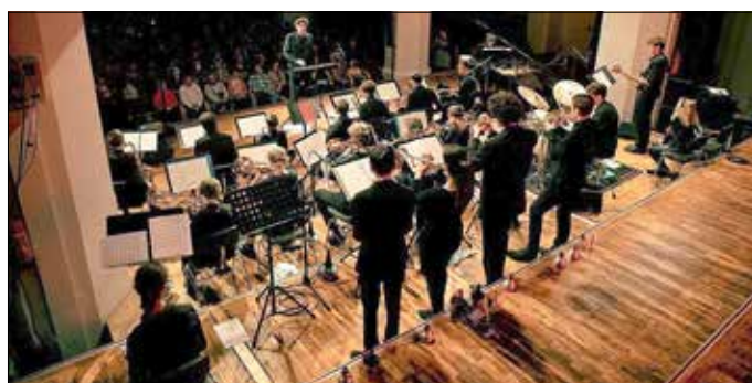
Abschlusskonzert in der Konzerthalle Carl-Philipp-Emanuel-Bach in Frankfurt (Oder).