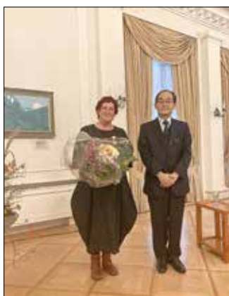
Beate Wonde mit dem japanischen Botschafter

Bevor der japanische Botschafter Yanagi Hidenao im Auftrag des Kaisers persönlich den