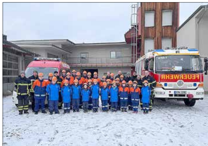
Die Teilnehmer und Ausbilder des Berufsfeuerwehrtages auf dem Gelände des BRKZ.

lände des BRKZ in Guben. Der Tag begann mit der Einteilung in 3 Gruppen und der Fahrzeug- und Gerätekunde. Denn niemand weiß, wann die Melder gehen und der erste Einsatz auf die Kinder und Jugendlichen wartet. Der Traum von der Feuerwehrfrau/ dem Feuerwehrmann wird also gelebt. An diesem Tag mussten nicht nur die feuerwehrtechnischen Aufgaben erledigt werden, sondern auch die Versorgung. Gemeinsam wurden die Schlafplätze hergerichtet und die Mahlzeiten zubereitet. Der erste Einsatz ließ auch gar nicht lang auf sich warten. Bis zum Abend standen dann 8 Einsätze auf dem Plan: ein Verkehrsunfall, kleine Brände, die Beseitigung einer Ölspur sowie ein Tier in Not. Der Abend klang am Lagerfeuer aus und die Kinder und Jugendlichen fielen müde in ihre Betten, jedoch immer mit dem Gedanken, es könnte jeden Moment ein Einsatz folgen. Die Nacht blieb jedoch ruhig und erst pünktlich zum Wecken musste eine Gruppe noch einen Baum von der Straße entfernen. Für alle Kinder und Jugendlichen war es ein spannender und aufregender Tag. Ganz im Sinne von Jugendfeuerwehr ist cool - Jugendfeuerwehr macht Spaß!