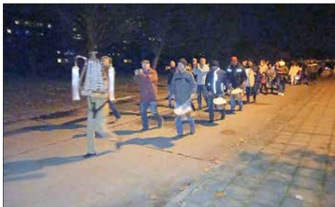
Der Spielmannzug Horno sorgte für die musikalische Begleitung des Lampionumzuges.

Der traditionelle Lampionumzug erfreute in diesem Jahr nach 2-jähriger Pause viele Familien aus der Kita Musikspielhaus. Auf der mit Lichtern geschmückten Terrasse konnten sich alle großen und kleinen Gäste mit Bratwurst und Tee stärken und die neuesten Neuigkeiten austauschen.