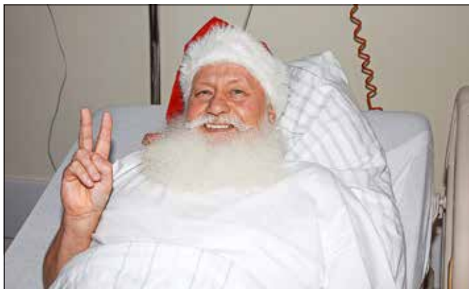
Der Weihnachtsmann ist optimistisch, dass er zum 24. Dezember wieder die Geschenke bringen kann.

Die positive Nachricht zuerst: Dem Weihnachtsmann geht es den Umständen entsprechend gut. Die schlechte Nachricht: Noch liegt er im Krankenhaus. Was ist geschehen?