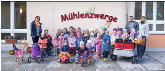
Erzieherinnen und Kinder vor der neu gestalteten Kita.

Der Umbau der ehemaligen Schule zur Kita in Groß Gastrose war eines der wichtigsten Projekte in der Gemeinde Schenkendöbern. Anfang Oktober haben die Mädchen und Jungen mit ihren Erzieherinnen ihre neue Kita in Groß Gastrose bezogen. Optimale Bedingungen nach neuestem Standard wurden durch die Gemeinde Schenkendöbern als Bauträger und die ausführenden Firmen geschaffen.