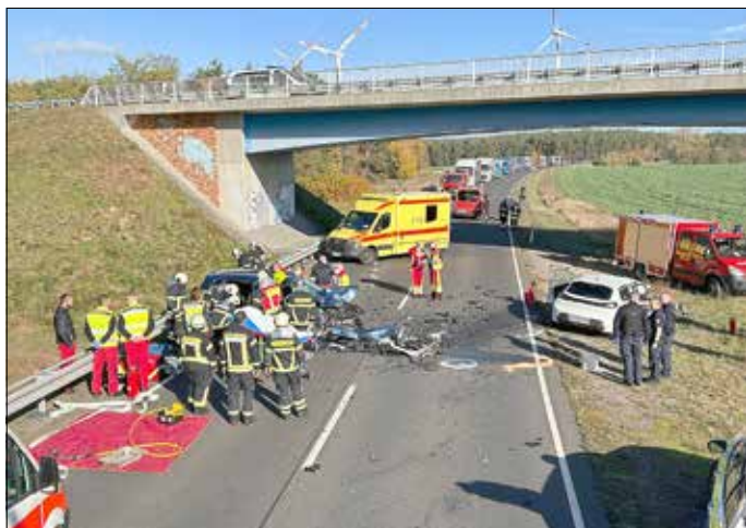
Die Einsatzstelle auf der B112.

Hier finden Sie einen Einblick der aktuellen Feuerwehreinsätze im November.