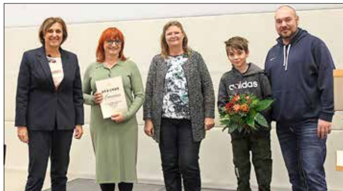
Die Vertreter der Europaschule bekommen eine Ehrenurkunde überreicht.

Am Mittwoch, dem 23. November 2022, fand in Kleinmachnow die Ehrungsveranstaltung „Sportlichste Schule 2021/22“ statt.