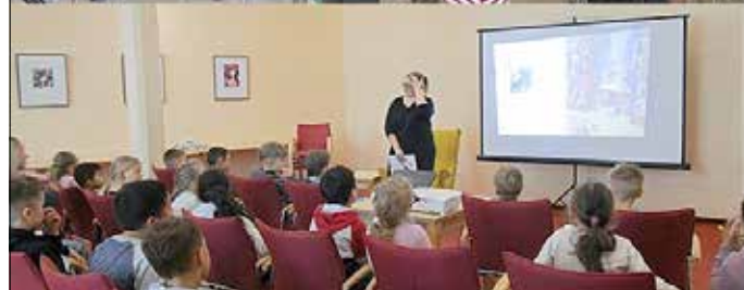
Die Kinder der Friedensschule an den verschiedenen Standorten des Vorlesetags.