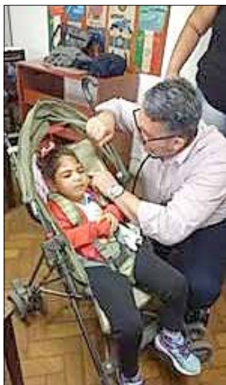
Ein Mädchen aus Rio bekommt erfolgreich ein Hörgerät eingesetzt.

Die Mitglieder des Rotary-Clubs Guben danken allen Gubenerinnen und Gubenern sowie allen Partnern aus den Bereichen der Hörgeräteakustik für die außergewöhnliche Unterstützung der Aktion „Hörgeräte für Rio“. Im Rahmen einer Videokonferenz konnten wir uns am 15. März 2023 vom Glück einiger Menschen, wieder hören zu können, überzeugen. Es hat uns sehr bewegt, wie sich Kinder, Seniorinnen und auch ein Mechaniker über ihre Geräte und ihr neues Leben freuen.