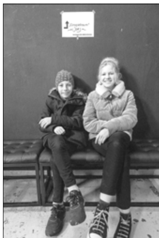
Beide Talente spielen in der erstklassigen Musikschulband The Peppermints .