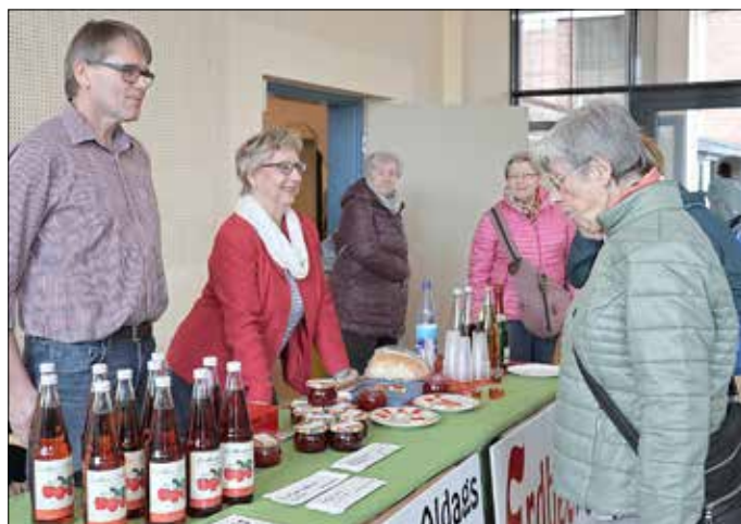
Die Erdbeermarmelade von „Wilhelm Aldag - Obstbau“ war heiß begehrt.