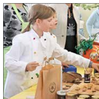
Das „Junge Gemüse“ aus der Corona-Schröter-Grundschule präsentierte selbst gemachte Aufstriche sowie Waffeln.

Wir freuen uns auf die nächste Produktmesse am 11. November 2023, dann heißt es wieder: Erleben Sie unsere regionale „Grüne Woche“ in Guben!