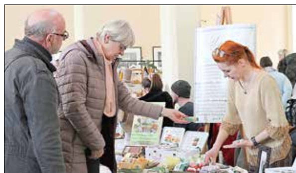
„AliSavon Seifenmanufaktur“, bot neu im Sortiment die Spreewälder Gurkenseife an.