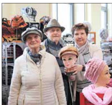
Die Gubener Hüte von „GubHut“ sind immer ein Renner.