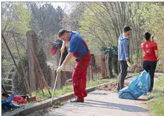
Die erfolgreiche Frühjahrsputzaktion startet in diesem Jahr wieder.

Nach längerer Pause möchte die Stadt Guben die erfolgreiche Frühjahrsputzaktion in diesem Jahr wieder aufleben lassen. Am Samstag, 22. April 2023 , soll zwischen 9:00 und 12:00 Uhr in gemeinschaftlicher Arbeit der Winterdreck aus der Neißestadt entfernt werden.