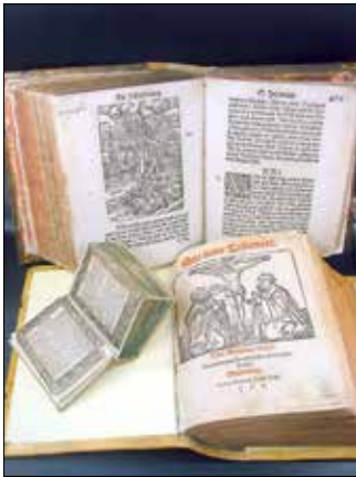
Das neue Testament.

Endlich ist es so weit: Die DEUTSCH-POLNISCHE QUMRAN-BIBEL-AUSSTELLUNG findet vom 6. bis 21. Mai 2023 im Gubener Ausstellungszentrum an der Alten Färberei statt.