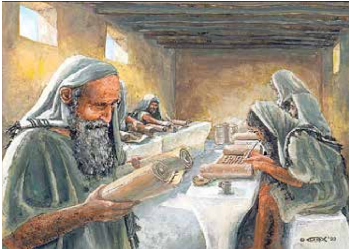
Die Qumran Siedlung.