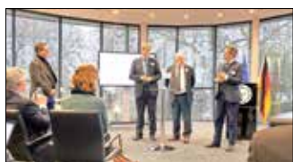
Vorstandssitzung in Kleve.

Vom 9. bis 10. März 2023 fand die erste diesjährige Vorstandssitzung unseres Dachverbands, der Arbeitsgemeinschaft Europäischer Grenzregionen, in Kleve statt. Am ersten Tag stand das Thema „Mobiles grenzüberschreitendes Arbeiten - neue Perspektiven für die Grenzregionen nach der Corona-Pandemie“ im Mittelpunkt. Im Rahmen eines Workshops, der in Zusammenarbeit mit dem Bundesinnenministerium erfolgte, wurden bspw. Fragen zum „Homeoffice“ in Grenzregionen oder die „Auswirkungen und Lehren aus der Pandemie auf grenzüberschreitende Arbeitsmärkte“ diskutiert. Darüber hinaus kamen Aspekte wie die Datenverfügbarkeit und der Datenaustausch sowie andere technische Koordinationsherausforderungen zur Sprache, um daraus mögliche Chancen für die Bürgerinnen und