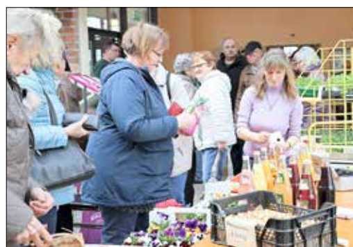
Die „Gärtnerei am Stadtpark“ zählt mit ihrem blühenden Sortiment u. a. zu den ersten Ausstellern der Produktmesse.