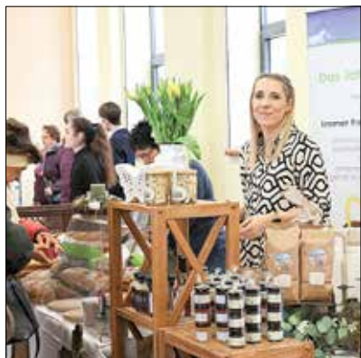
Das „Gut Neu Sacro“ hatte erstmalig Käse aus eigener Produktion im Angebot.