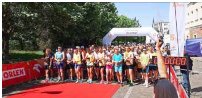
Startschuss des letzten Laufes.

Ca. 300 Freizeitsportler werden am Sonntag, 21. Mai 2023 , an der 9. Auflage dieses grenzübergreifenden Städtelaufes durch die Eurostadt Guben-Gubin erwartet. Der Hauptlauf ist 10 km lang, dazu gibt es weitere Sportangebote, wie z. B. den Kinderlauf „Lauf mit dem Meister“. Der Star des diesjährigen Laufes ist jedoch noch ein Geheimnis. Die Anmeldung zum Kinderlauf sind