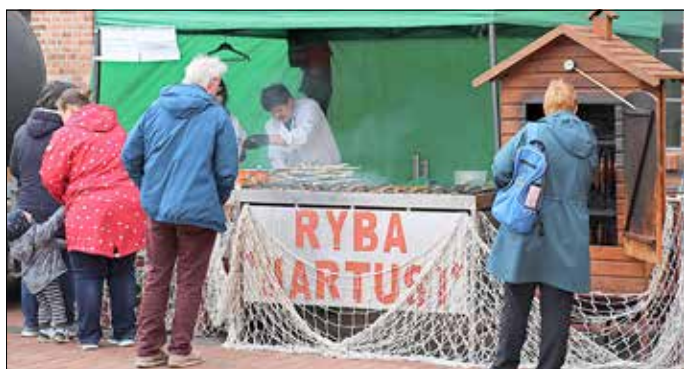
Frischen Fisch gab es auch in geräucherter Form beim polnischen Fischhändler aus Zary.