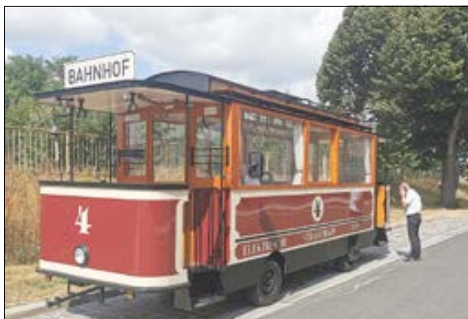
Straßenbahnnachbau der SWG.

Der Gubener Heimatbund e. V. möchte am 8. April 2024 an ein bedeutendes Gubener Ereignis erinnern, das sich nun zum 120. Male jährt. Am 24. Februar 1904 begann der reguläre Betrieb der Straßenbahn zwischen der Frankfurter Straße und dem Bahnhof. Hierzu stellen uns die Gubener Stadtwerke ihren Straßenbahnnachbau zur Verfügung. Dieser wird am 8. April 2024 von 10:00 bis 17:00 Uhr im Hof der Volkssolidarität in der Berliner Straße Nr. 35 zur Besichtigung stehen. Wir laden alle ein, vorbeizukommen und einen Teil der Gubener Zeitgeschichte zu erleben.