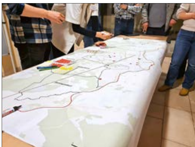
Bestandsanalyse anhand des Gubener Stadtplans.