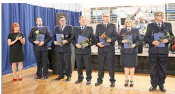
Ehrungen der Freiwilligen Feuerwehr Guben zum 160. Jubiläum.