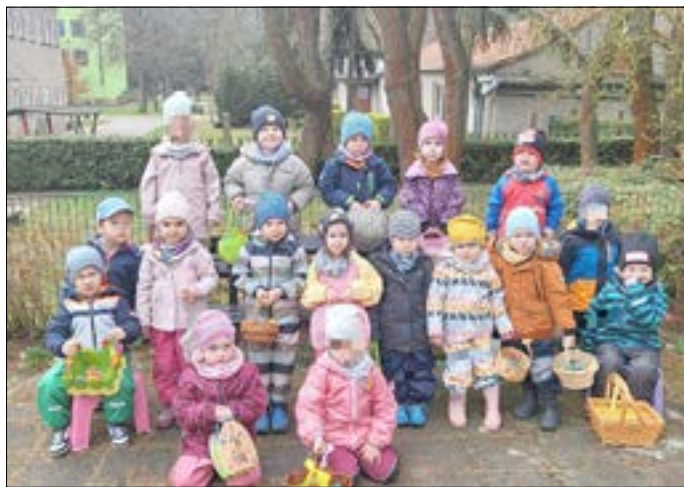
Erfolgreiche Ostersuche.

Kurz vor Ostern suchten die Kinder des Kinderhauses „Dreikäsehoch“ auf dem weitläufigen Kitagelände in Grano Ostereier. Sehr aufgeregt und voller Erwartungen begannen die Mädchen und Jungen mit der Suche. Wo hat der Osterhase nur die Ostereier und die Körbchen versteckt? Gespannt und voller Vorfreude wurde jeder Winkel auf dem Spielplatz abgesucht. Am Ende fand jedes Kind sein Osterkörbchen mit einer kleinen Überraschung darin. Mit strahlenden Augen und einem zufriedenen Lächeln verbrachten die Kinder anschließend noch etwas Zeit auf dem Spielplatz.