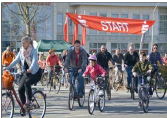
Am 14. April 2024 heißt es wieder Anradeln.

Der Frühling ist da, und das Wetter lockt in die Natur. Der Gubener Radsport e. V., die Gubener Wohnungsbaugenossenschaft eG (GwG) und der Marketing und Tourismus Guben e. V. laden zum traditionellen Gubener Frühlingsanradeln ein. Speziell unseren kleinen Radfahrern sollen besondere Angebote unterbreitet werden. Die GwG eG stellt jedem startenden Kind bis 14 Jahre einen kleinen Verpflegungsrucksack zur Verfügung und die Kinder und Eltern sind eingeladen, die kleine Runde