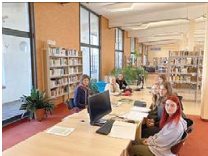
Station in der Stadtbibliothek.