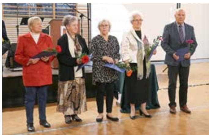
Auszeichnung des Stadtchors zum 100-jährigen Bestehen.