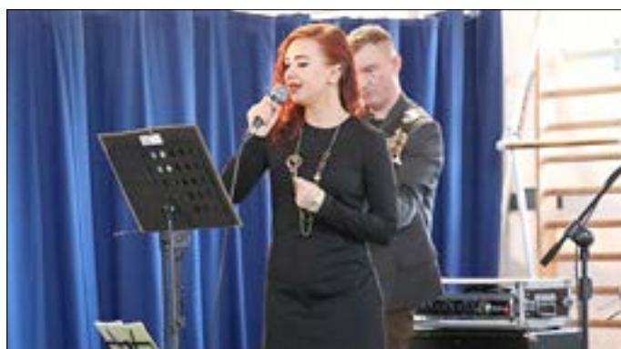
Gubiner Jarocki Band.