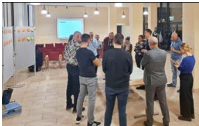
Austausch der Mitglieder des Bürgerrates.