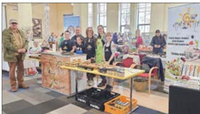
Das Junge Gemüse der Corona-Schröter-Grundschule.

Üblicherweise werden runde Geburtstage mit Festakt und schönen Reden gewürdigt. Die Veranstalter und Teilnehmer der 21. Produktmesse am 16. März 2024 haben dafür keine Notwendigkeit gesehen. 54 Anbieter und 2.500 Besucher bestätigten jedoch die ungebrochene Nachfrage nach diesem Format.