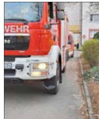
Hilfeleistung der Feuerwehr.

Wer sich bei der Freiwilligen Feuerwehr Guben engagieren möchte, findet alle Informationen unter www.feuerwehr-guben.de .