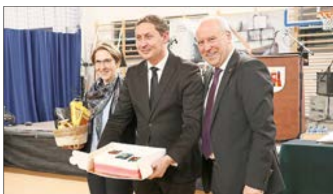
Silke Pohl, stellv. Bürgermeisterin von Laatzen, gemeinsam mit beiden Bürgermeistern der Doppelstadt.