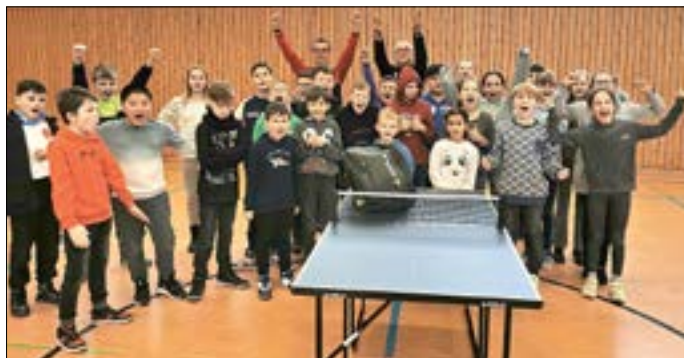
ESV Lok Guben übergibt eine neue Tischtennisplatte an die Mädchen und Jungen der Friedensschule.

Beim Ortsentscheid der Mini-Meisterschaften im Tischtennis Ende Januar war die Friedensschule nach 2023 erneut die am zahlreichsten vertretene Grundschule aus Guben und Schenkendöbern. Sage und schreibe, 30 der 40 gestarteten Mädchen und Jungen gehen in die Einrichtung an der Gubener Schul-