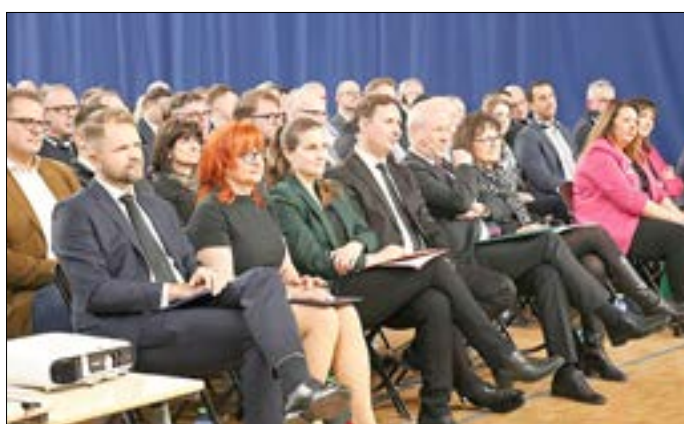
Geladene Gäste Gäste aus Politik und Wirtschaft.