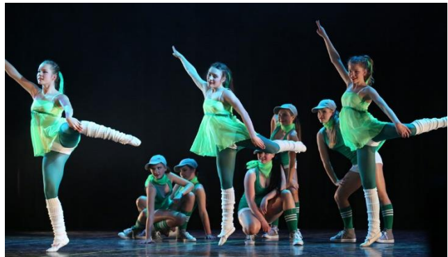
„Fire & Flame“ Tanzensemble e.V. Eisenhüttenstadt

Das Tanzensemble tritt am 8. Juli 2023 um 16:00 Uhr auf dem Friedrich-Wilke-Platz auf.