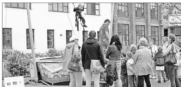
Die Kombination aus hopsen und fliegen beim Bungee-Trampolin zog viele Kinder an.

Bullenreiten, Kletterwand mit Rutsche und Ponyreiten. Die Stadt Guben bedankt sich beim Fördermittelgeber und bei allen Einrichtungen und Vereinen, die an diesem Tag zum Gelingen des Festes beigetragen haben.