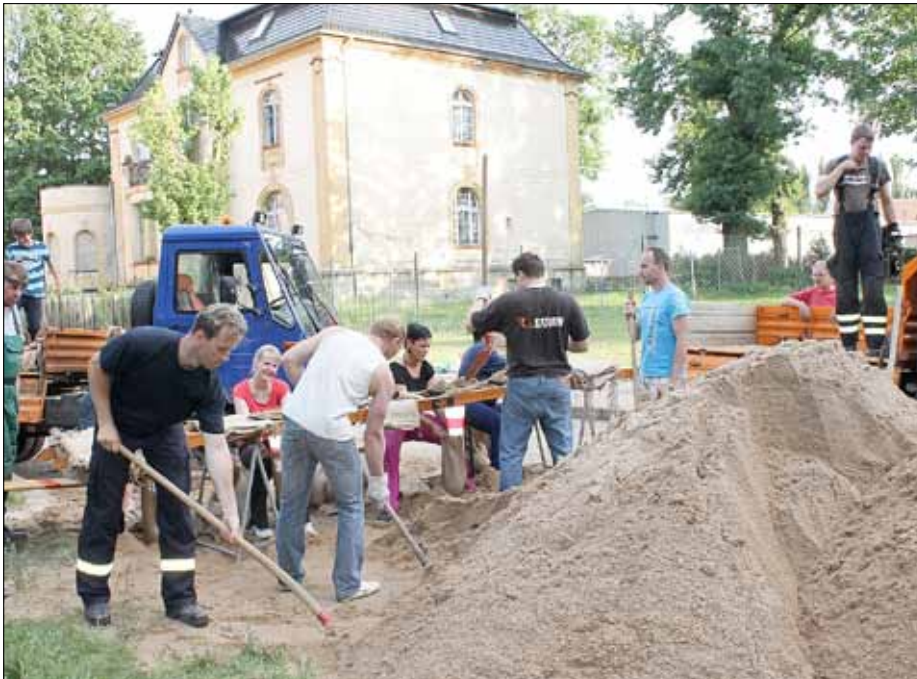
Besonders beeindruckt zeigte sich der amtierende Bürgermeister von der Tatsache, dass auch Gubener beim Sandsackschippen halfen, die in der Obersprucke und somit weit weg von der Neiße wohnen.

Beilage: Amtsblatt für die Stadt Guben und die Gemeinde Schenkendöbern