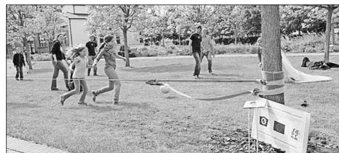
Fußball als Freizeitbeschäftigung für Groß und Klein wird wohl nie seinen Reiz verlieren.