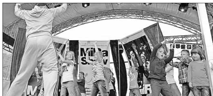
Zumba ist auch schon etwas für die Kleinsten, wie die Flex-Fitnessoase bewies.