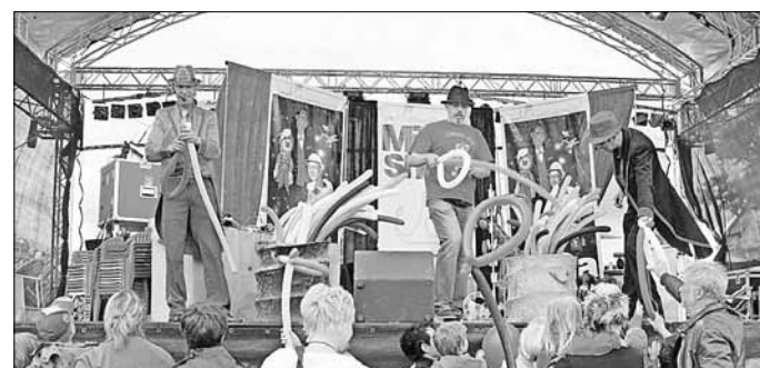
„Komm hol das Lasso raus“ - passend zur Musik gab's bei der MiRa-Show auf der Bühne eine Luftballon-Lasso für jeden.