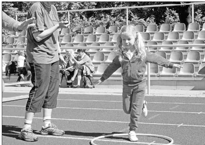
Einbeinsprung: Absprung mit dem linken Bein in den Reifen und fünf Sekunden halten. Dann das Gleiche mit dem rechten Bein.