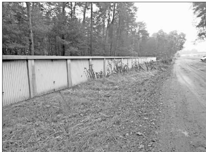
Garagenkomplex Reichenbacher Straße

Es gilt das Datum des Posteingangsstempels bei der Stadt Guben.