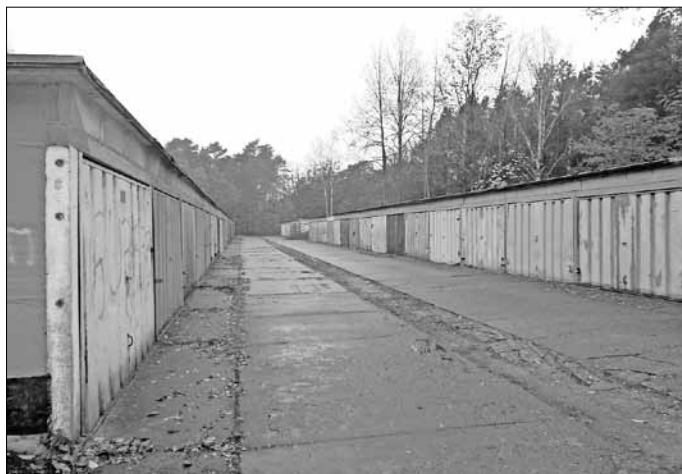
Garagenkomplex Wilschwitzer Weg