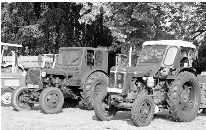
Traktorparade, Foto: MuT

Traktorparade der Bubbatzfreunde Kerkwitz e. V. auf der Grünfläche am Torhaus