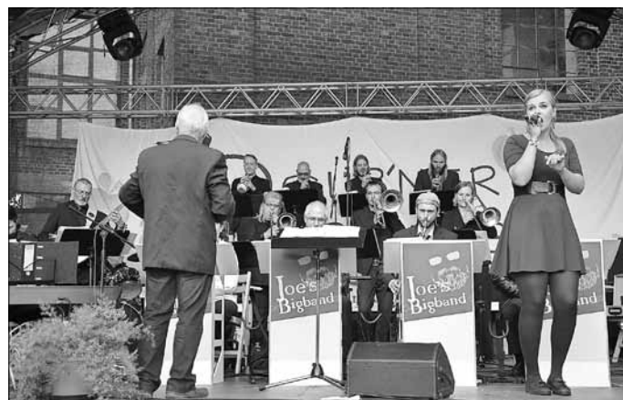
Joe's Bigband

Spritzig-swingiger Bigband-Sound und eigene Arrangements von Werken verschiedenster Stilrichtungen. Mit viel Leidenschaft und Freude an der Bigbandmusik, verbunden mit Show-