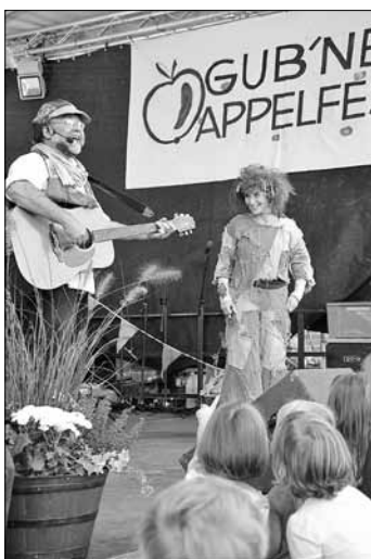
Zwulf und Zwuse, Foto: Kinder- musiktheater Zwulf

Zum großen Vergnügen aller Kinder und ihrer Familien gibt es zunächst ein großes Durcheinander auf der Bühne, bis beide merken, dass Freundschaft etwas Wunderschönes ist. Mit wortwitzigen Dialogen und viel Musik nähern sich die Welten von ZWULF und ZWUSEL einander an und die Fantasie der Zuschauer wird dabei mächtig angekurbelt.