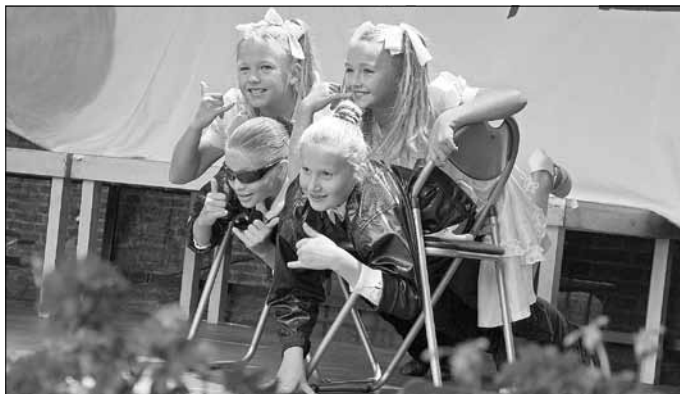
New Dance.

New Dance zum Appelfest – Kinder- und Jugendensemble der Städtischen Musikschule „Johann Crüger“