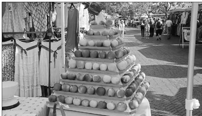
Markttreiben, Foto: MuT

Auf dem Festgelände dreht sich alles rund um den Apfel. So werden Apfelgeschichten erzählt, Äpfel können gekostet werden und eine lustige Apfelwand zum Fotografieren lässt die Besucher in den Apfel schlüpfen. Eine Spielwiese für große und kleine Kinder steht wieder zur Verfügung. Das „Netzwerk Gesunde Kinder“ bietet für die Kleinsten eine Krabbelecke an.