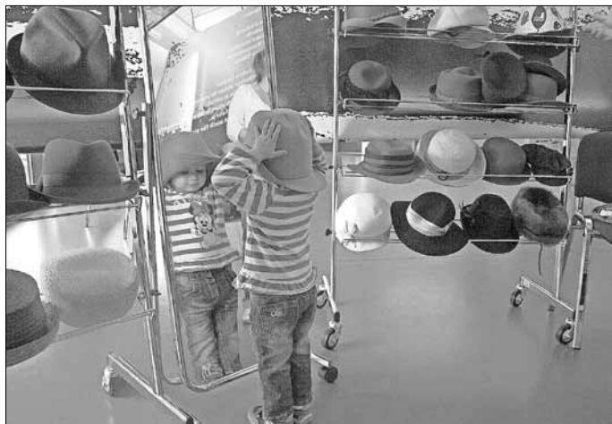
„Echte Hutprobierstation“ im Stadt- und Industriemuseum.

Zur 13. Spree-Neiße-Museumsnacht und am Vorabend des bundesweiten „Tag des Denkmals“ soll am Samstag, 09. September 2017 , insbesondere die jüngere Generation unter dem Motto „ Handwerk-Kunst und Kreativität beiderseits der Neiße “ in Guben aktiv werden. Eingebettet in das parallel stattfindende 23. Gub'ner Apfelfest werden deutsche und polnische Jugendliche von 16.00 bis 19.00 Uhr auf der Festwiese vor dem Rathaus bei einem geschichtlichen Graffiti-Projekt überdimensionale Hüte kreativ gestalten. Das Stadt- und Industriemuseum zeigt die mobilen Ausstellungsstücke später in der speziellen Sonderausstellung „Graffiti-Hut“. Die kleinen Besucher können zur Museumsnacht jeweils um 16.30, 17.00 und 17.30 Uhr spannenden Vorlesegeschich-