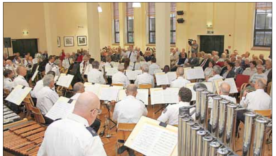
Zahlreiche Besucher erlebten im vergangenen Jahr zum Benefizkonzert in der ausverkauften Alten Färberei einen stimmungsvollen Konzertabend mit einem gut aufgelegten Landespolizei-Orchester.

zu erfassen, zu erhalten und zu pflegen. Der Erlös des Benefizkonzertes in Guben dient dem Anliegen des Volksbundes. bs