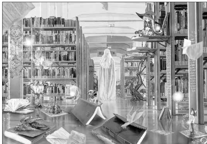
„Fantasy Library“ in der Stadtbibliothek.

Im Sonderausstellungsraum des Gubener Museums sind von 16 bis 21.30 Uhr viele Aquarelle, Öl- oder Acryl-Bilder der Schau „Faszination Landschaft“ von Manfred Ewersbach zu sehen. Im ehemaligen Hutcafé präsentiert sich die Gubener Apfelwein Schüler GmbH von 17.00 bis