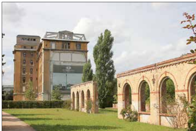
Das Haus D der ehemaligen Gubener Wolle könnte künftig eine Rolle im Bildungscampus spielen.

In den kommenden Jahren ergeben sich aus den weiteren demographischen Veränderungen und einem stärkeren Zusammenwachsen der Städte Guben und Gubin neue Herausforderungen und Chancen für den Bereich der Bildungsinfrastruktur in unserer Stadt. Aus diesem Grund hat die Stadt Guben ein Gutachten „Untersuchungen zur Weiterentwicklung der Bildungsinfrastruktur und Sportanlagen in den Stadtumbaugebieten der Stadt Guben unter besonderer Berücksichtigung des Standortes Schulstraße/Alte Poststraße für die Errichtung eines Bildungscampus Altstadt Ost“ in Auftrag gegeben. Die Ergebnisse des Gutachtens wurden am 17. Februar 2021 im Ausschuss für Soziales, Bildung, Jugend und Kultur präsentiert. Unter Berücksichtigung der Bedeutung des Umlandes Gubens wurden in dem Gutachten zukünftige Bedarfe ermittelt und Potenziale untersucht, um die Kita- und Schulinfrastruktur bedarfsgerecht