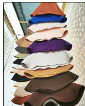
Hutstumpen aus dem Stadt- und Industriemuseum in Guben.

Über einzelne Schritte des Projektes und den aktuellen Arbeitsstand werden wir regelmäßig über die Museumswebseite, Facebook und Instagram informieren.