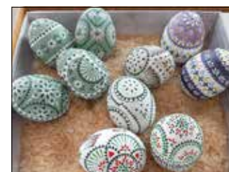
Kunstwerke aus der Ausstellung „Ich schenk Dir ein Osterei“.