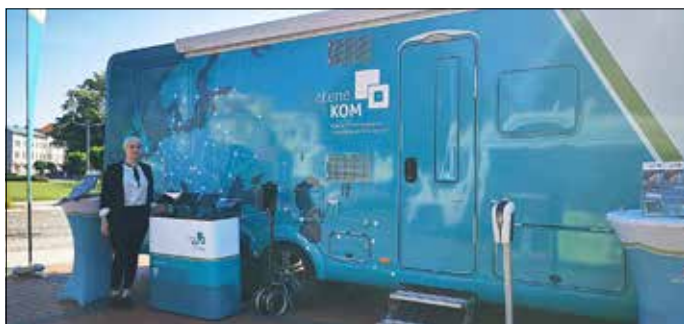
Das Infomobil der atene KOM.