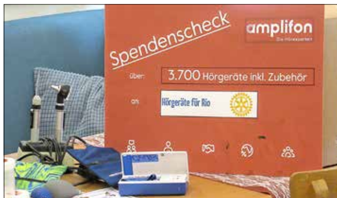
Spendenscheck im Wert von 3.700 Hörgeräten.