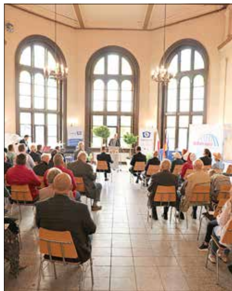
Blick in den geschichtlichen Veranstaltungssaal des Bahnhofsgebäudes.