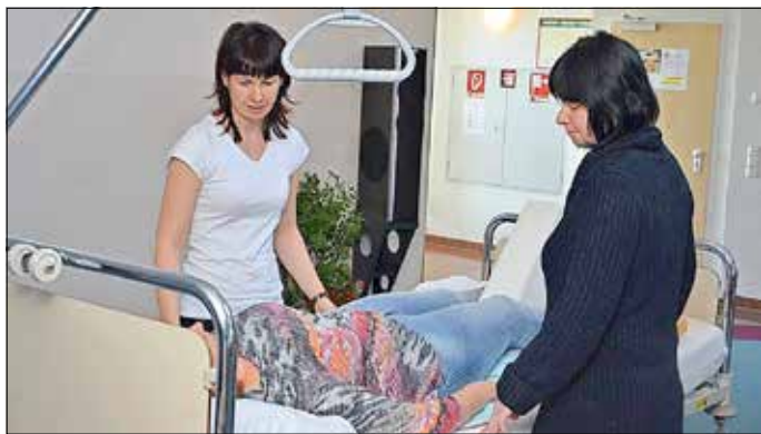
Ausbildung in der Gesundheits- und Krankenpflegehilfe.