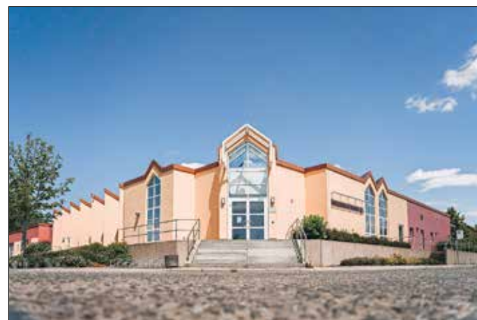
Das Freizeitbad in der Kaltenborner Straße 163.

Alle Aqua- und Schwimmkurse können zu den regulären Zeiten besucht werden. Die Öffnungs- und Kurszeiten sind online unter www.guben.de , „Freizeit & Tourismus - städtische Bäder“, zu finden.