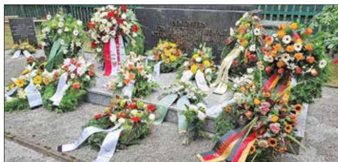
Nachdem Niederlegen der Kränze an den Massengräbern auf dem Jamlitzer Waldfriedhof richteten die offiziellen Gedenkreder ihre teils emotionalen Ansprachen an die Gäste.

des früheren nationalsozialistischen KZ-Außenlagers Lieberose verlegt. Zu den Inhaftierten gehörten neben unbelasteten deutschen Zivilisten, sowjetischen und polnischen Staatsbürgern auch zahlreiche Funktionsträger der NSDAP und anderer NS-Organisationen. Bis zu seiner Auflösung im April 1947 wurden dort mehr als 10.000 Personen inhaftiert, rund 3.400 von ihnen starben an den katastrophalen Haftbedingungen sowie an Krankheit, Hunger, psychischer und physischer Entkräftung. Bei