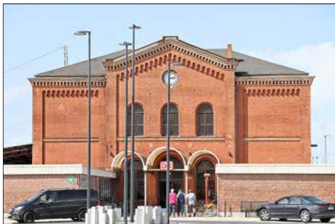
Blick auf das Gubener denkmalgeschützte Bahnhofsgebäude

Aus diesem Grund fand am 25. August 2021 eine Jubiläumsveranstaltung der Bahn in Guben statt. „Für uns Gubener*innen und Gubiner*innen hat unser Bahnhof eine ganz besondere Bedeutung. Familienangehörige und Freunde werden verabschiedet und begrüßt.