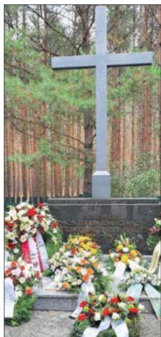
Gedenkkreuz mit der Aufschrift, „Den Opfern von Terror und Gewalt Internierungslager Jamlitz 1945 - 1947“.

Auf dem Waldfriedhof Jamlitz fand am 11. September 2021 die 32. Gedenkveranstaltung zu Ehren der Opfer des sowjetischen Speziallagers Nr. 6 statt. Eingeschlossen in das Gedenken waren auch die Opfer des KZ Jamlitz. Die Stadt Guben ist regelmäßig bei diesen Gedenkveranstaltungen vertreten. Sie ist es auch deshalb, weil sich in Guben eine Dienststelle der GPU (sowjetische Geheimpolizei) befand. Dienststellen wie diese waren zumeist die erste Station für lange Haftzeiten in den Speziallagern.