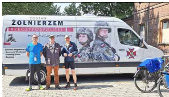
(v. l.) Oberst Grzegorz Dyrka, Leiter des Fachbereiches III für Ordnungsbehördliche Leistungen/Umwelt und Kommandeur des Landeskommandos Brandenburg, Oberst Olaf Detlefsen.

Fachbereich III - Ordnungsbehördliche Leistungen/Umwelt