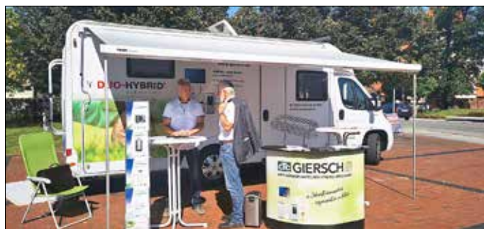
Infostand über moderne Heizsysteme.