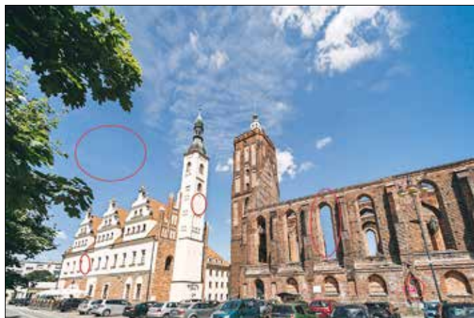
Lösung aus der Ausgabe 12/2021.