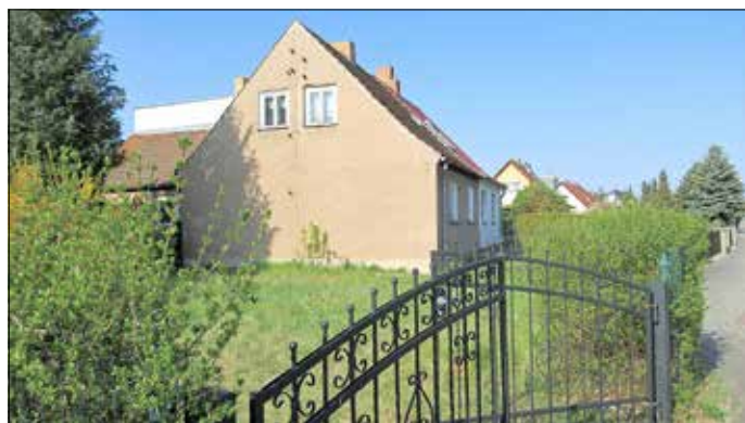
Zu verkaufendes Grundstück in der Otto-Thiele-Straße.