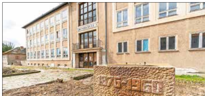
Ehem. Wilhelm-Pieck-Schule, Grundschule 3

Ansicht des neuen Pflegefachzentrums, links ist der Neubau zu sehen.