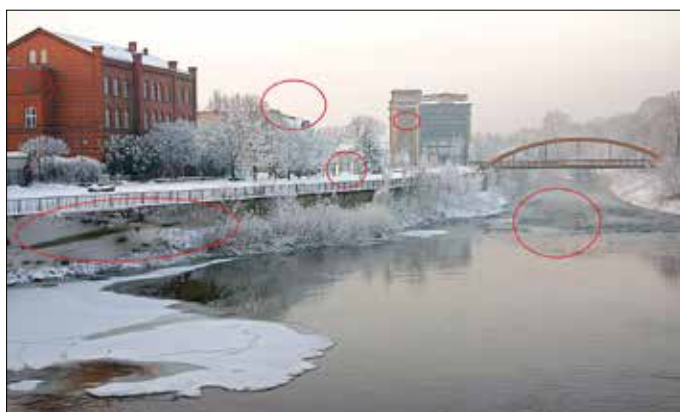
Lösungsbild der letzten Ausgabe (NE 17/2021).