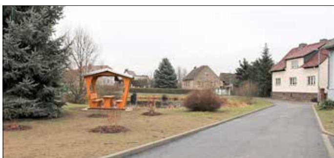
Der Dorfanger mit Spielplatz und Feuerwehrgerätehaus ist ein Treffpunkt für alle Generationen im Gubener Ortsteil Bresinchen.

Ende Juli des letzten Jahres begannen die Arbeiten zum grundhaften Ausbau und zur Neugestaltung des Dorfangers Bresinchen. Die damals noch mit Löchern durchsetzte Fahrbahn bereitete den Verkehrsteilnehmenden sowie besonders den Anwohnern großen Unmut. Nach 19 Wochen Bauzeit konnte der neue Dorfanger Bresinchen Mitte Dezember für den Verkehr freigegeben werden.