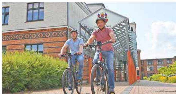
2020 wurden in Guben 63.132 Radfahrer insgesamt gezählt. (173 pro Tag, in der Saison 240)