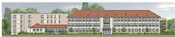
Hier entstehen: 1 Tagespflege mit 24 Plätzen, 18 barrierefreie Wohnungen und 82 Pflegeplätze.

Ansicht des neuen Pflegefachzentrums, links ist der Neubau zu sehen.