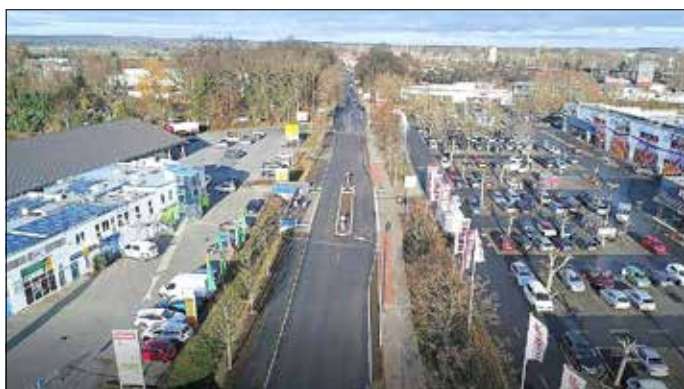
Die Baumaßnahme fand im Rahmen des Projektes „GUB-E-BUS – gemeinsame grenzüberschreitende Mobilität in der Eurostadt Guben-Gubin“ statt.