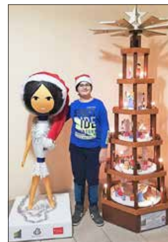
Fotoaktion mit dem weihnachtlichen Kopsinchen.