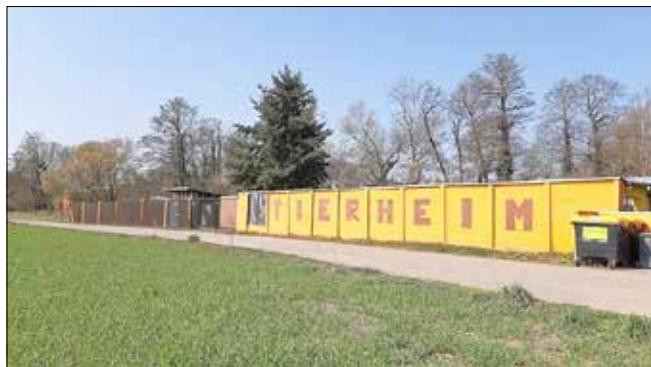
Gubener Tierheim, Vorderes Klosterfeld 1.

Wir bedanken uns herzlich für Ihre Spendenbereitschaft. Auch im letzten Jahr erreichten uns wieder viele Futter-, Sach- und Geldspenden zum Weihnachtsfest und zum Jahreswechsel. Besonders in dieser schwierigen Zeit ist Ihre Unterstützung für unser Tierheim von Bedeutung. Das Wohl unserer Tierheimtiere liegt uns am Herzen und mit Ihrer Unterstützung können wir sie auch weiterhin gut versorgen. Das ganze Team vom Gubener Tierheim sagt DANKE!