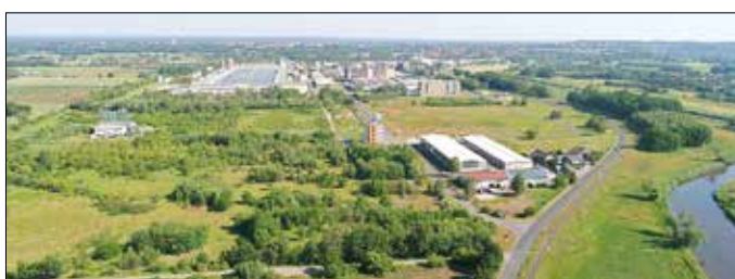
Südlicher Blick auf das Gubener Industriegebiet.