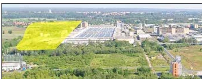
Der Bereich der Westerweiterung des Industriegebietes ist gelb markiert.