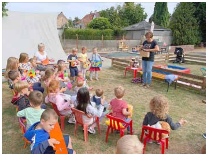
Die Kinder waren mit vollen Spaß dabei.