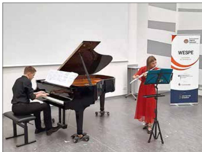
Die Anspannung während des Auftritts war groß, doch letztendlich erzielten sie einen Sonderpreis.

kannt oder selber komponiert sind. Eingeladen zu der Veranstaltung waren mehr als 120 ausgewählte Preisträgerinnen und Preisträger des Wettbewerbs „Jugend musiziert“ aus ganz Deutschland und deutschen Schulen im Ausland. Dieser Wettbewerb ist ausschließlich für die Jugend musiziert-Preisträger. Das bedeutet, zu diesem Wettbewerb wird man erst eingeladen, wenn der Regional-, Landes- und Bundeswettbewerb bereits erfolgreich hinter einem liegt.