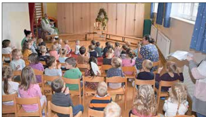
Erntedankfest im Kindergarten

In jedem Jahr, am Montag vor dem offiziellen christlichen Erntedankfest, feiern Erzieherinnen und Kinder im Kindergarten des Naëmi-Wilke-Stifts Erntedank. Mit einem Erntedanktisch, einer schönen geflochtenen Erntekrone, Blumen und kleinen Körbchen mit Gottes Gaben wurde am 26. September 2022 der Saal entsprechend geschmückt. Pastor Michal Voigt hielt eine „Mini-Predigt-Andacht“ in kindgerechter Form, in der er den Überfluss in reichen Ländern und den Hunger in armen Ländern thematisierte. Und er betete mit den Kindern. „Wir singen und freuen uns daran, dass Gott für uns sorgt. Wir sagen ganz bewusst Danke und loben den Schöpfer. Das ist es, was wir am Ernte-Dank-Fest tun“, erklärt eine Erzieherin den Kindern den Sinn des Festes.