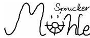
Die Sprucker Mühlenfreunde