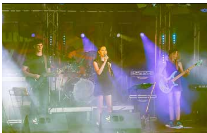
Auf dem Festival trat auch die Musikschulband The Peppermints auf.