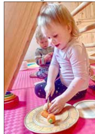
Neues Angebot für Kinder ab 6 Monaten.