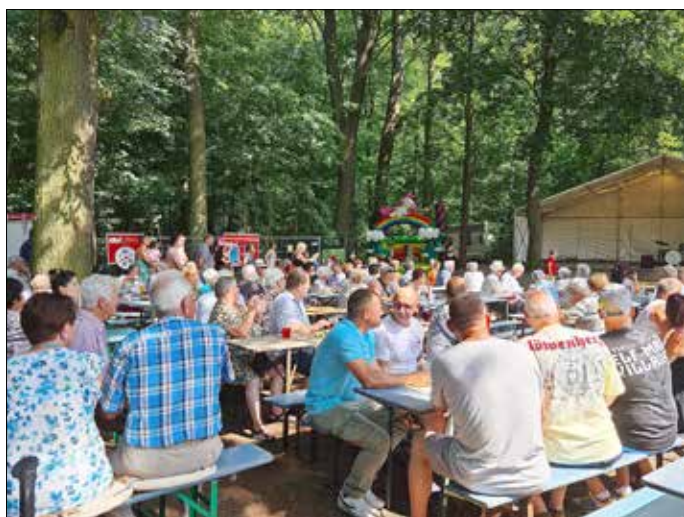
Hunderte Besucher kamen zum Parkfest.