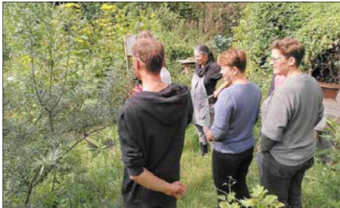
Kräuterwanderung unter der Leitung von Frau Németh.

Das neue Herbstprogramm bietet alt bewährte, aber auch mehr als dreißig neue Kurse, die zum Entdecken und Lernen einladen.