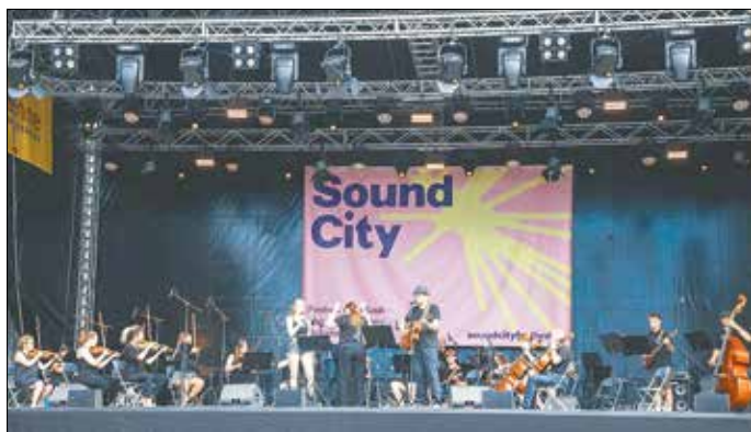
Das ZupfStreichOrchester Guben.