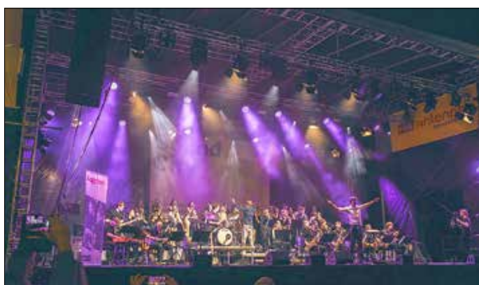
Das Landesjugendjazzorchester Junior.