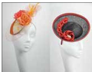
Links: „Sunny Roses“ – Rechts: „Summer Poppy“ aus der Kollektion „Elegance“.