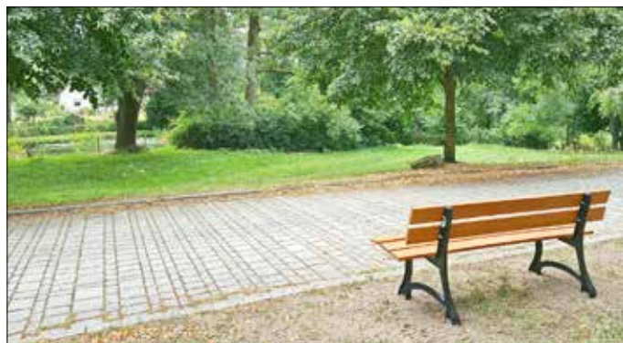
Malerischer Blick über den Dorfteich.

Über ein echtes Schmuckstück freuen sich derzeit die Senioren im Ortsteil. In Absprache mit der Gemeindeverwaltung und dem Ortsbeirat konnte die erste von zwei Bänken fest installiert werden. Mit Blick auf den idyllischen Dorfteich dürfte es nun dem einen oder anderen Granoer, der nicht mehr so gut zu Fuß ist, leichter fallen, eine Dorfrunde zu laufen. Jetzt, wo endlich die Möglichkeit besteht, an der Bank eine Pause einzulegen.