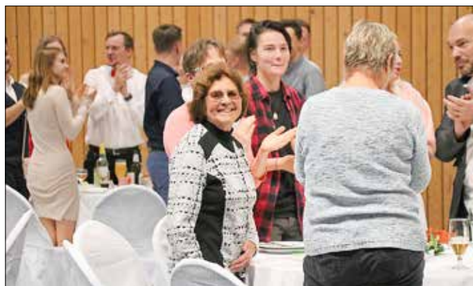
Die Gubener Ausnahme-Trainerin Hildegard Petter wurde u. a. im letzten Jahr geehrt, außerdem ist sie Trägerin des Verdienstkreuzes am Bande.