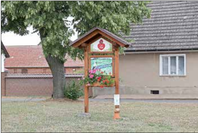
Aufsteller zum diesjährigen 555-jährigen Bestehen des Ortsteils Deulowitz, finanziert aus dem Ortsteilbudget.

Erstmals konnten die Bürgerinnen und Bürger der Stadt Guben über das neue Bürgerbudget, welches im aktuellen Doppelhaushalt 2023/2024 verankert ist, abstimmen. Damit beteiligt die Stadt Guben ihre Einwohnerinnen und Einwohner jährlich an der Gestaltung des städtischen Haushaltes im Rahmen eines gesondert bereitgestellten Budgets. Die Höhe des Budgets für 2023 beträgt 17.000 Euro. Bis zum 31. März 2023 konnten alle Bürgerinnen und Bürger der Stadt Vorschläge für die Verwendung des Bürgerbudgets abgeben. Anschließend wurden die Vorschläge zur Abstimmung gestellt.