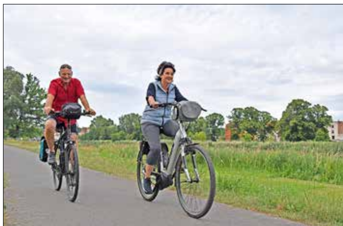
Natur und Geschichte erleben.

Die Touristinformation Guben und der Radwanderführer Gert Richter laden zur Radwanderung ein. Es lässt sich die einzigartige Kombination aus Natur und Geschichte auf der geführten Radwanderung „Schulenburg-Denkmal und Schönhöhe“ erle-