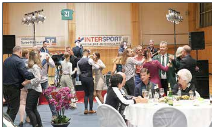
Der Tag des Ehrenamtes fand 2022 im Rahmen eines Sportballes statt.

Anlässlich des Tages des Ehrenamtes, am 17. November 2023, möchte der Gubener Bürgermeister Fred Mahro die Menschen, die sich im besonderem Masse ehrenamtlich engagieren, würdigen. Hierfür bitten wir um Ihre Unterstützung und damit verbundenen Vorschläge. Bereiche des Ehrenamtes der Stadt Guben können sein: