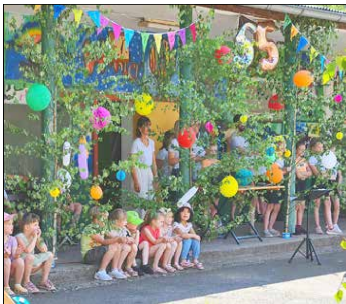
55. Geburtstag Kita Grano.

Anlässlich des 55. Geburtstages der Kita in Grano gab es am 7. Juli 2023 für alle Kinder, Eltern, Großeltern, Beschäftigten, den Förderverein, Vertretern der Verwaltung und ehemalige Mitarbeiter eine zünftige Geburtstagsfeier. Bei heißem Sommerwetter konnten alle Gäste ein Programm der Kitakinder erleben, am Kuchenbuffet schlemmen oder sich aktiv mit den Kids an verschiedenen Aktivitäten beteiligen.