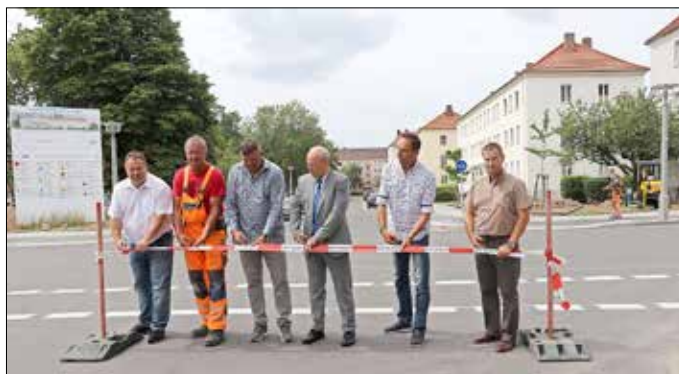
Eröffnung des 1. Teilabschnitts am 27. Juli 2023 mit den ausführenden Firmen sowie Vertretern der Stadtverwaltung.

Im Februar 2022 hat der grundhafte Ausbau der Friedrich-Engels-Straße und der Hegelstraße begonnen. Ab der Pestalozzistraße in Richtung Rosa-Luxemburg-Straße erfolgte die Baumaßnahme unter Vollsperrung. Die Maßnahme umfasste die Erneuerung der Fahrbahn, Gehwege einschließlich der Bordanlagen, den Neubau der Straßenentwässerung sowie der Straßenbeleuchtung in der Friedrich-Engels-Straße und der Hegelstraße. Der Ausbaubereich in der Friedrich-Engels-Straße hat eine Gesamtlänge von ca. 305 m und in der Hegelstraße ca.