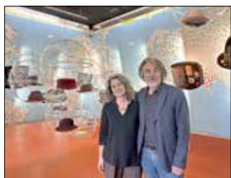
Frau und Herr Temperli besuchen das Stadt- und Industriemuseum.