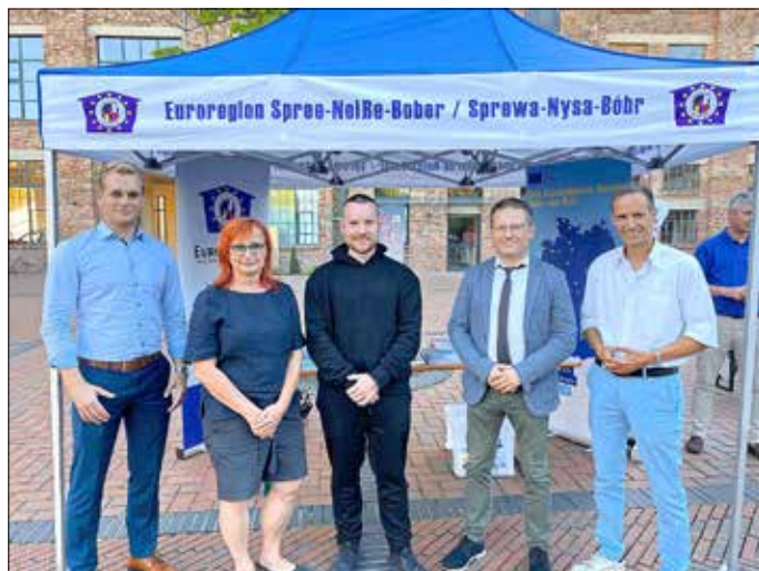
Eröffnung der Innovationswoche