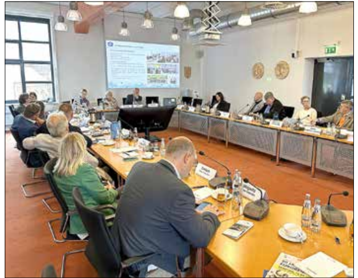
Stadtverwaltung Guben © Euroregion Spree-Neiße-Bober e.V.