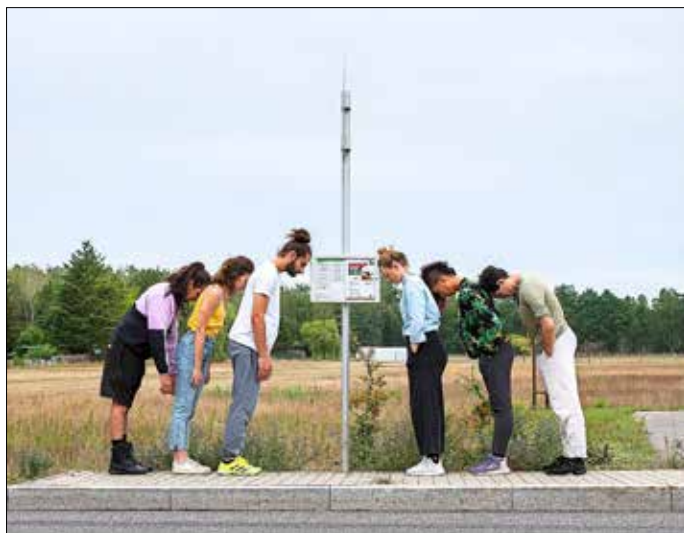
Klänge der Lausitz

Die Aufführung „Klänge der Lausitz“ ist für alle zugänglich. Der Eintritt ist frei. Um Anmeldung wird gebeten, telefonisch unter 0356168711042 oder per E-Mail: spielorte@freie-daku-brandenburg.de.