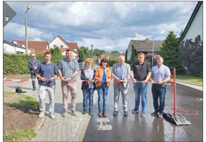
Eröffnung des 2. Bauabschnittes am 31. August 2023