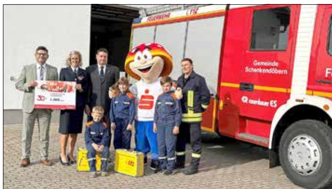
Scheckübergabe der PS-Lotterie.

Das PS-Lotterie-Sparen der Sparkasse Spree-Neiße feiert sein 30. Jubiläum. Anlässlich ihres Jubiläums machen sie Vereine glücklich, mit zusätzlich 30 mal 1.000 Euro für gute Projekte und Vorhaben.