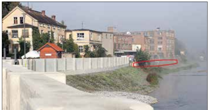
Im markierten Bereich wird die Hochwasserschutzwand verlängert.