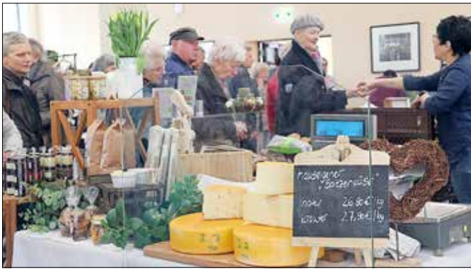
Entdecken Sie am 11. November 2023 auf der Gubener Produktmesse die Vielfalt unserer Region.

Die Stadt Guben lädt am Samstag, 11. November 2023, zwischen 10:00 Uhr und 17:00 Uhr in der Alten Färberei ein. Dort findet bereits die 20. Gubener Produktmesse statt. Auf der Gubener Produktmesse sind die unterschiedlichsten Aussteller vertreten, welche regionale Erzeugnisse aus den Branchen Lebensmittel, Kunstgewerbe und Textilien vorstellen und zum Kauf anbieten. Kartoffeln, Nudeln, Backwaren, Wurst und Käse aus der näheren Umgebung – der Einkauf regionaler Lebensmittel liegt im Trend. Dieser Tendenz folgen die Gubener Bürgerinnen und Bürger seit über 9 Jahren. 2014 veranstaltete die Stadt Guben die erste Produktmesse mit