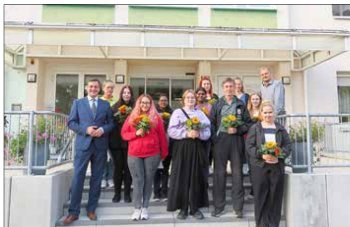
Berufsstart in die Pflege.