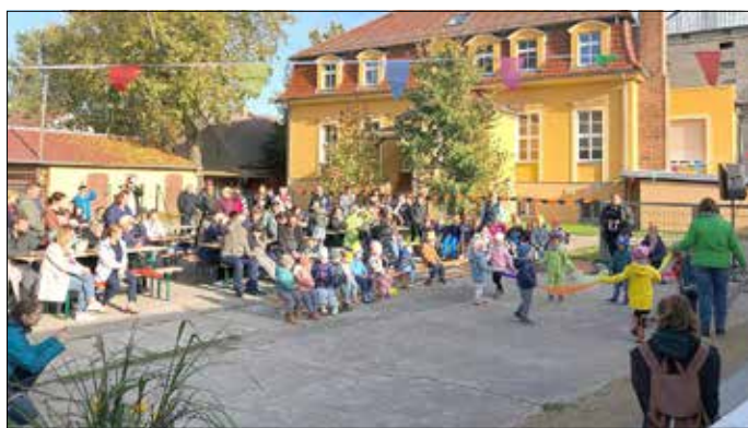
Zum Herbstfest gab es bestes Wetter.

Ihr traditionelles Herbstfest hat kürzlich die Kita „Mühlenzwerge“ in Groß Gastrose gefeiert. Bei schönstem Sonnenschein und herbstlich geschmücktem Gelände präsentierte jede Kitagruppe einen kleinen Beitrag mit Liedern, Gedichten und Tänzen. Großen Applaus gab es dafür von den zahlreich erschienen Eltern und Großeltern.