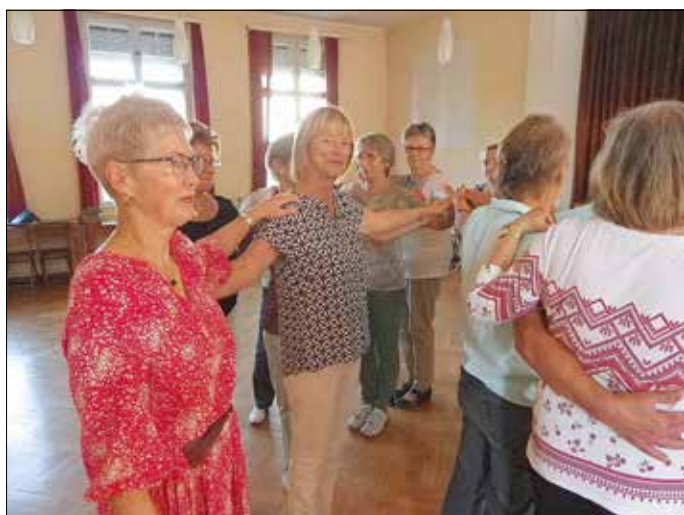
Abwechslungsreicher Seniorentanz.

Es gibt viele Wege, im Alltag nicht einzurosten oder zu vereinsamen. Tanzen ist bestimmt einer der angenehmsten. Wer tanzt, wählt auch eine der unterhaltsamsten Formen, den Körper in Schwung und den Kreislauf auf Touren zu bringen. In den letzten Jahren hat der Seniorentanz sich ständig verbessert, ist abwechslungsreicher und anspruchsvoller geworden. Deshalb wird vom Bundesverband Seniorentanz diese Art des Tanzens als „ ErlebnisTanz “ bezeichnet. Es gibt kaum eine an-