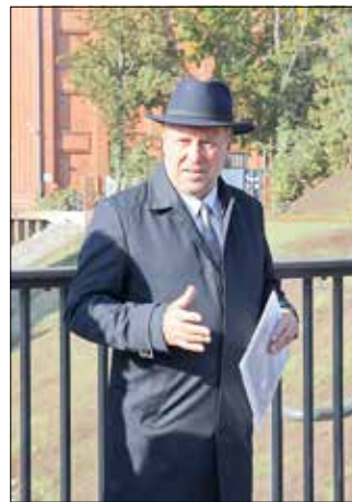
Bürgermeister Fred Mahro.

Auch das bisher letzte Hochwasserereignis 2013 verdeutlichte, wie notwendig die Sanierung der Hochwasserschutzwand ist.