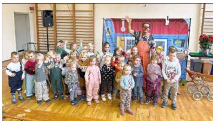
Alle hatten sichtlichen Spaß.

Einen ganz besonderen Vormittag erlebten kürzlich die Mädchen und Jungen der Kita „Mühlenzwerge“ in Groß Gastrose. Zu Gast war der Müllmann Clown Heine, er führte die Kinder spielerisch an das Thema Mülltrennung heran. Eingebettet in eine kleine Geschichte erfuhren sie, was man mit Recycling alles erreichen kann. Müllmann Clown Heini erklärte kindgerecht mit Zauberei, Clownerie und viel Musik, welchen Beitrag man von klein an mit Mülltrennung zum Umweltschutz leisten kann. Mit Elan und viel Freude machten die Kitakinder jederzeit aktiv mit und lernten so auf leichte und spielerische Art und Weise den verantwortungsvollen Umgang mit der Natur und eine saubere Umwelt.