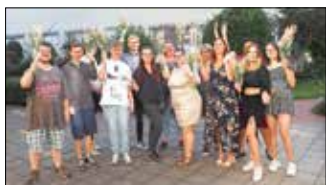
Die Absolventen des Jahrgangs 2022/23.

Erfolgreiche Abschlüsse und viele Neuanfänge im Bereich der Gesundheits- und Krankenpflegehilfe. Von 19 Auszubildenden, die im vergangenen Jahr an den Start gingen, haben zehn Ende September ihre Ausbildung beendet. Drei von ihnen sind jetzt Mitarbeitende des Naëmi-Wilke-Stifts und zwei