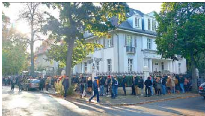
Lange Warteschlange am Wahltag vor der polnischen Botschaft in Berlin.

Am 15. Oktober 2023 fanden die polnischen Parlamentswahlen statt. Zwei Tage später verkündete die Wahlkommission das amtliche Endergebnis, wonach im Sejm die Oppositionsparteien – die liberalkonservative Bürgerkoalition (KO), das konservativ-liberale Wahlbündnis „Der dritte Weg“ und die „Neue Linke“ auf 248 der insgesamt 460 Sitze kommen und somit eine Regierung bilden könnten.