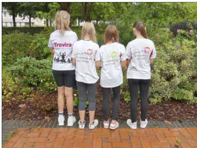
Die Klasse 6b besuchte das Gubener Tuche und Chemiefaser Museum.