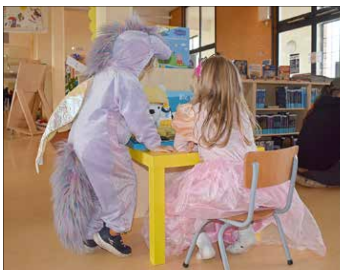
Wunderschöne Kostüme gab es zu probieren.

„Es war einmal ...“ eine Bibliothek in ihrem sonntäglichen Dornröschenschlaf in einer kleinen Stadt namens Guben. Eigentlich war es ein ganz gewöhnlicher Sonntag im Herbst, genauer gesagt, der 22. Oktober, als sich plötzlich in der 2. Stunde des frühen Nachmittags die Türen der Bibliothek öffneten. Scharen von großen und kleinen Märchenkennern, Märchenliebhabern und märchenhaften Wesen strömten in die zum Märchenwald verwandelte Bibliothek.