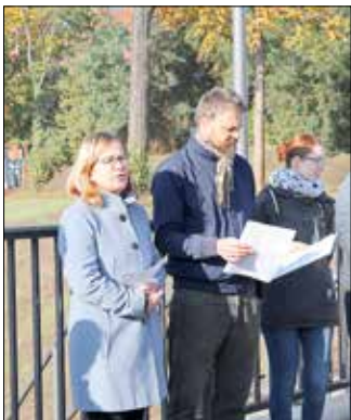
Staatssekretärin Anja Boudon übergab den fertigen Bauabschnitt.

Mit dem am 18. Oktober 2023 fertiggestellten Bauabschnitt wurde die bereits vorhandene Hochwasserschutzwand um weitere 148 Meter bis auf das Gelände des Plastinariums verlängert. Dabei wurde ein Auslaufbauwerk sowie ein Pumpwerk im Auslaufbereich der Egelneiße errichtet. Die Arbeiten hat die Firma Meyer Tiefbau GmbH & Co. KG Geschäftsstelle Falkensee fertiggestellt. Vorangegangen waren umfangreiche Vorarbeiten, wie das Entfernen von Bäumen im Uferbereich und das Anlegen einer Baustraße durch die ortsansässige Firma ULT e.G. Guben.