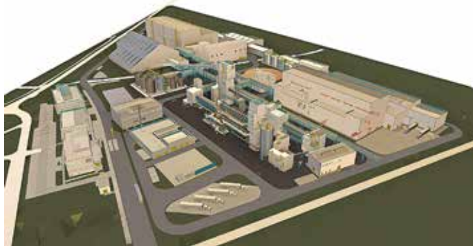
Grafische Darstellung der gesamten Anlage.

Das Bundeswirtschaftsministerium hat kürzlich ein neues Programm aufgelegt, das es Rock Tech Lithium ermöglicht, bis zu 200 Mio. Euro an staatlicher Förderung zu beantragen. Mit diesem Förderprogramm unterstützt die Bundesregierung Projekte entlang der Batteriewertschöpfungskette. Ziel ist es, die Wertschöpfungskette auf dem Gebiet der Batterien speziell in