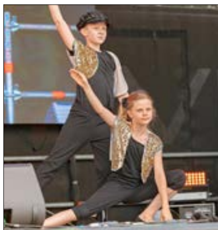
Die Tänzer der Städtischen Musikschule „Johann Crüger“.