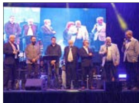
Die Eröffnung des Frühlingfestes am Freitagabend.