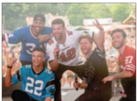
Die Jungs von TEAM 5ÜNF hatten Spaß bei ihrem Auftritt.