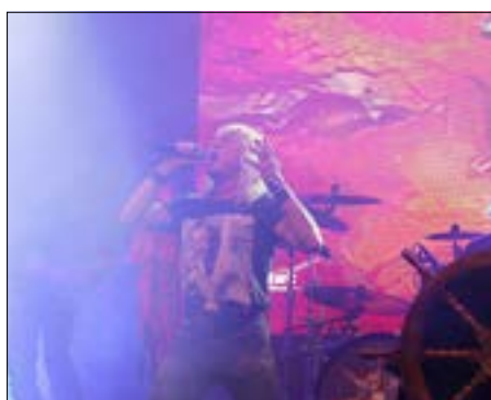
Die Klabaubermann – Santiano Tribute Band.