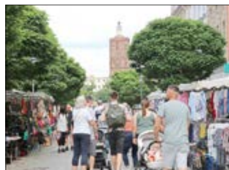
Blick auf die Gubiner Stadt- und Hauptkirche.