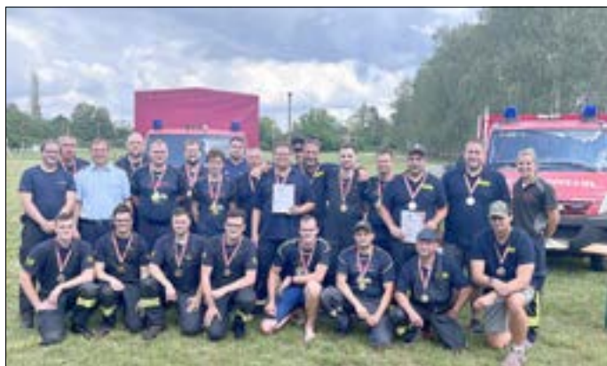
Siegerehrung der Mannschaften.

Der Samstag, 25. Mai 2024, stand bei den Feuerwehren der Stadt Guben und der Gemeinde Schenkendöbern ganz im Zeichen des Sportes. Neben der Teilnahme von 2 Mannschaften am Oderlandmarsch, haben sich 14 Jugendfeuerwehrmannschaften, 1 Frauen- und 10 Männermannschaften in Groß Gastrose getroffen, um die Stadt- und Gemeindemeisterschaft im Feuerwehrsport auszutragen. Darunter waren auch 2 Mannschaften der polnischen Partnerwehr von Groß Gastrose, aus Markosice. Ein herzliches Dankeschön an die Organisatoren, Unterstützer und alle helfenden Hände, die dazu beigetragen haben, dass der sportliche Samstag erfolgreich durchgeführt werden konnte.