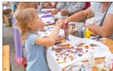
Kreativ-Workshop für die Kleinen.