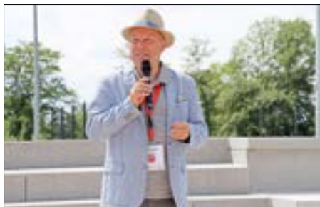
Bürgermeister Fred Mahro bei der Eröffnung.