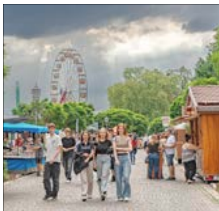
Am Freitagabend gab es leider kräftige Regenschauer.