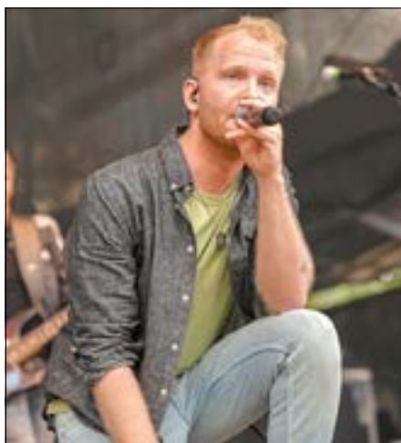
Sänger von Goldplay.live, der Coldplay Tribute Band.