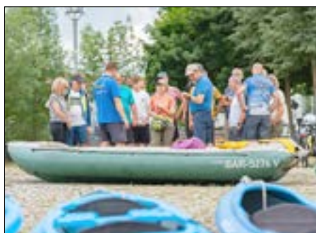
Wassersportangebote an der Neiße.