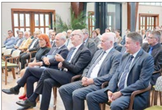
Auch der Ministerpräsident Woidke zählte zu den Gästen.

Mit einem feierlichen Festakt erinnerte die Stadt Guben gemeinsam mit der Gemeinde Schenkendöbern am Donnerstag, 23. Mai 2024 an das Inkrafttreten des Grundgesetzes vor 75 Jahren, an die Friedliche Revolution in der damaligen DDR sowie an den Fall der Mauer vor 35 Jahren. Dadurch wurde ein starkes Zeichen für die freiheitliche Demokratie und gegen politischen Extremismus gesetzt. 80 geladene Gäste aus Politik, Verwaltung und Bürgerschaft nahmen an diesem bedeutsamen Ereignis im Begegnungszentrum des neuen Pflegefachzentrums in Guben teil. Darunter befanden sich Ortsvorsteher, Stadtverordnete,