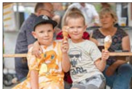
Das Eis schmeckt auch bei Regenwetter.