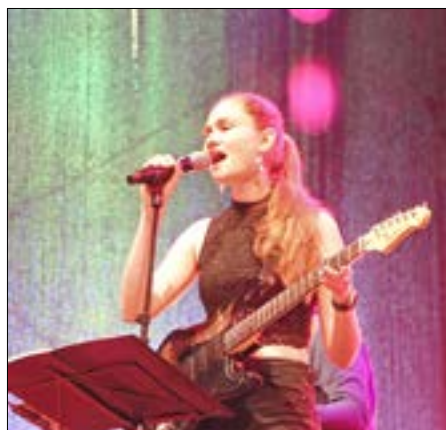
The Peppermints.