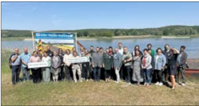
Vertreter der Projektpartner.

Der Radverkehr ist ein bedeutender Wirtschaftsfaktor im Tourismus. Die Untersuchung setzt die Reihe der Radverkehrsanalysen fort, die für den brandenburgischen Abschnitt des Oder-Neiße-Radwegs bereits seit 2009 durchgeführt werden. Die Ergebnisse der Studie wurden am 13. Mai 2024 im Theater am Rand in Zollbrücke (Brandenburg) vorgestellt.