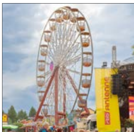
Blick auf das Riesenrad.