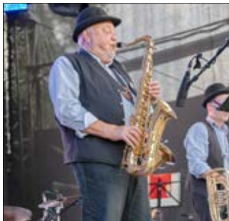
Die Cottbuser Dixieland Stompers.