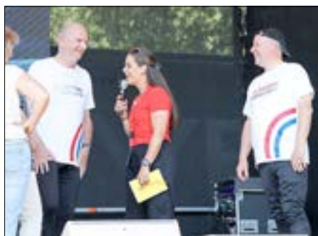
Der Ministerpräsident hielt sein Wort und lief gemeinsam mit dem Bürgermeister mehrere Runden.