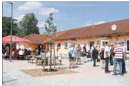
Vereinshaus des „1. FC Guben e.V.“.