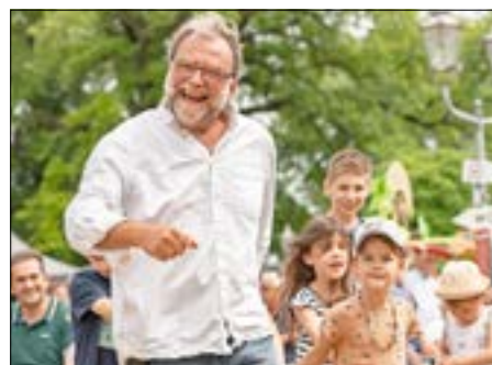
Kinderprogramm mit Käpt´n ZWULF.