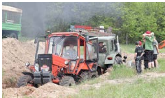
Technik zum Staunen.