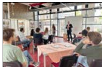
Austausch im Stadt- und Industriemuseum.