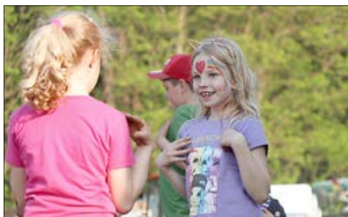
Ab 17:00 Uhr startet die Kinderdisco.