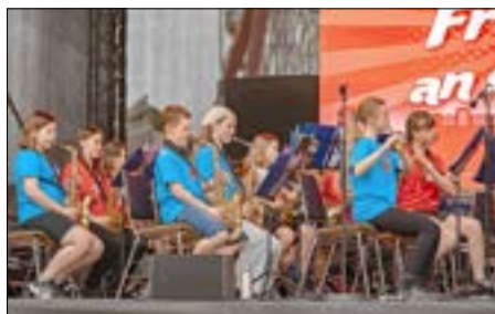
Bläserklassen der Friedensschule sowie der Corona-Schröter-Grundschule.