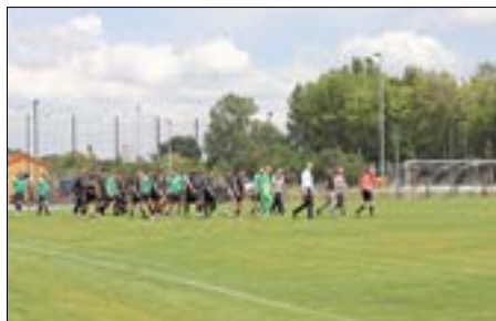
Einlauf der Mannschaften.