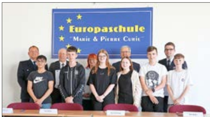
Klassenvertreter freuten sich über das neue Wahlpflichtfach Feuerwehr.

Das zusätzliche Lernangebot soll den Gubener Schülern u. a. bei der Berufsorientierung sowie bei der Heranführung an gesellschaftliche und ehrenamtliche Tätigkeiten unterstützen oder auch Wissen im Bereich der Gefahrenabwehr vermitteln. Beginnend mit dem Schuljahr 2024/2025 wird das Wahlpflichtfach Feuerwehr an der Europaschule einmal wöchentlich für die Klassenstufen 9 bzw. 10 angeboten. Unterrichtet werden die Schüler ehrenamtlich von den Kameraden der Freiwilligen Feuerwehr!