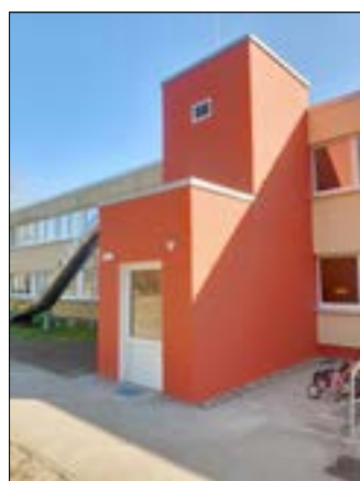
Personenaufzug nach der Fertigstellung.

Die Gubener Kita Regenbogen hat nach intensiven Baumaßnahmen einen neuen Personenaufzug erhalten. Der Einbau des Fahrstuhls wurde notwendig, um den hohen Standard der Betreuung und die Sicherheit der Kinder zu gewährleisten. Die Gesamtkosten beliefen sich auf 250.000 Euro. Die neuen baulichen Maßnahmen umfassen nicht nur den Einbau des Fahrstuhls, sondern auch die Anpassung der Fassade, die Installation von Wärmedämmung und Flachdächern sowie die Integration in die bestehende Brandmeldeanlage.