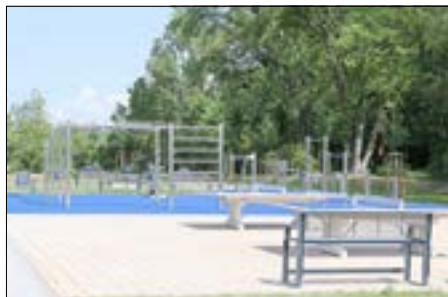
Der Fitnessparcours im öffentlichen Bereich der Anlage.