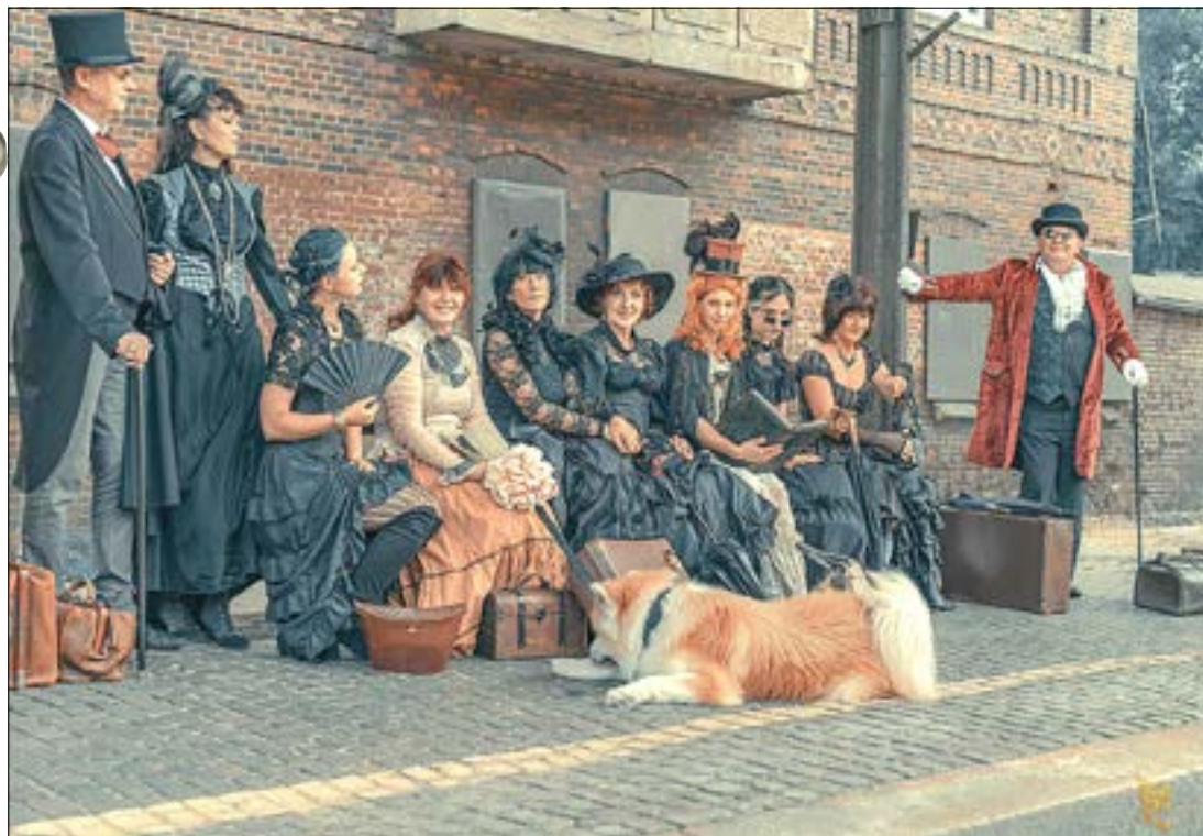
Originalbild. © ArtFox Fotografie, Fotografin: Ulrike Schöll

Machen Sie mit und gewinnen Sie einen Guben-Gutschein im Wert von 20 Euro . Senden Sie die korrekte Fehleranzahl mit Ihrem Namen und Ihrer Anschrift bis zum 18. Juni 2024 per E-Mail an lehmann.l@guben.de oder werfen Sie das Rätsel gekennzeichnet in den Briefkasten der Stadtverwaltung Guben. Der oder die Gewinner/in wird in der nächsten Ausgabe am 28. Juni 2024 veröffentlicht. Der Rechtsweg ist ausgeschlossen.