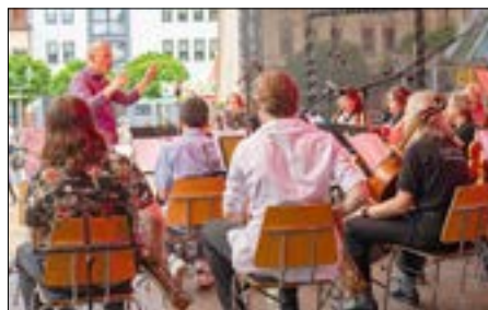
Blasorchester der Städtischen Musikschule „Johann Crüger“.