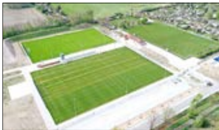
Mit der umfangreichen Modernisierung wurde auch ein neuer Parkplatz geschaffen.