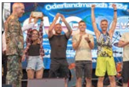
Die glückliche Siegermannschaft des Oderlandmarsches.