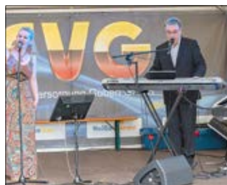
Livemusik gab es mit dem Duo Joy auf der Nebenbühne.