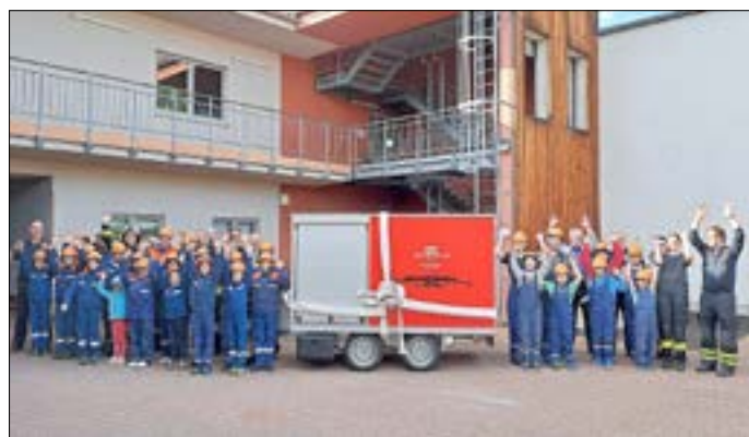
Neuer Ausbildungsanhänger für die Jugendfeuerwehr.

Anfang Mai erhielt die Jugendfeuerwehr der Stadt Guben, bestehend aus den Feuerflitzern, der Jugendfeuerwehr Bresinchen sowie Guben-Mitte ihren neuen Ausbildungsanhänger .