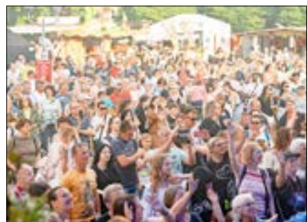
Sonntag feierten alle bei bestem Wetter.

Die Stadt Guben bedankt sich bei allen Sponsoren, der Energieversorgung Guben GmbH, Städtische Werke Guben GmbH, Abwasserbehandlungsanlage Gubin sowie bei unserem Medienpartner rbb-Antenne Brandenburg für die großartige Unterstützung zum Stadtfest.