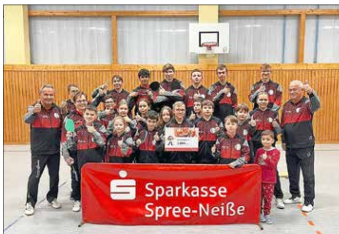
Große Freude über die neuen Trainingsanzüge.

Im Jahr 2024 bewarb sich der ESV Lok Guben mit einem Projekt um Fördermittel aus dem PS-Sparen der Sparkasse Spree-Neiße. Ziel war es, die über 30 Mädchen und Jungen des Tischtennis-Nachwuchses mit einheitlichen Trainingsanzügen auszustatten, um den Teamgeist zu stärken und den jungen Sportlerinnen und Sportlern ein professionelles Auftreten zu ermöglichen.