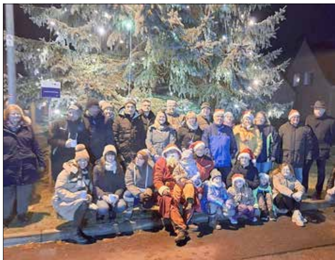
Adventssingen am Bresinchener Weihnachtsbaum.

Am 7. Dezember 2024 fand die traditionelle Rentnerweihnachtsfeier in der Bergschänke statt. Bei einem gemütlichen Nachmittag, begleitet von einem liebevoll gestalteten Kinderprogramm, genossen die Rentnerinnen und Rentner weihnachtliche Musik, Kaffee, Lebkuchen und Stollen. Gemeinsam wurde in geselliger Atmosphäre die Adventszeit eingeläutet. Eine besondere Überraschung war in diesem Jahr der Kalender mit historischen Ansichten aus Bresinchen, der allen Gästen überreicht wurde.