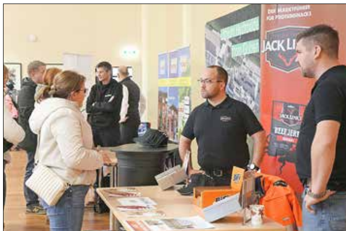
Besucher kamen gezielt mit den Arbeitgebern ins Gespräch.