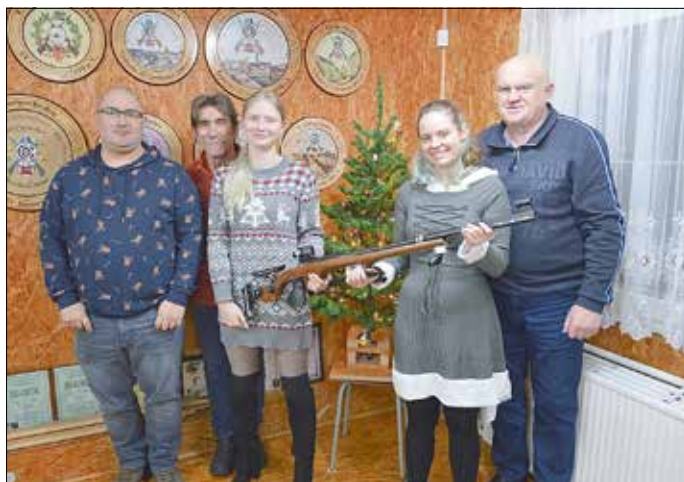
Eine Spende für die Jugendförderung des Gubener SV Germania 1890 e.V.

Zum traditionellen Adventsschießen kamen am 14. Dezember 2024 die Mitglieder des Gubener Schützenvereins Germania