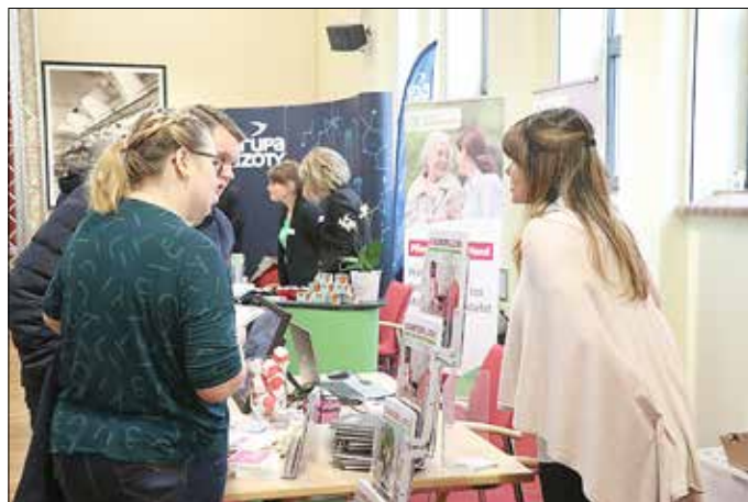
Der Tag richtet sich nicht nur an Rückkehrer, sondern an alle die eine neue Perspektive suchen.

Viele Besucher nutzten gezielt die Gelegenheit, mit potenziellen Arbeitgebern ins Gespräch zu kommen. Besonders die jüngsten Entwicklungen, wie die Entlassungswelle bei Trevira, haben dazu beigetragen, dass in diesem Jahr mehr Menschen den Weg zum Rückkehrertag fanden als im Vorjahr. Auch medial war die Veranstaltung ein Erfolg: Der rbb war wie im vergangenen Jahr vor Ort, führte Interviews mit Besuchern und berichtete anschließend in einem positiven Beitrag bei „Brandenburg aktuell“ über das Event.