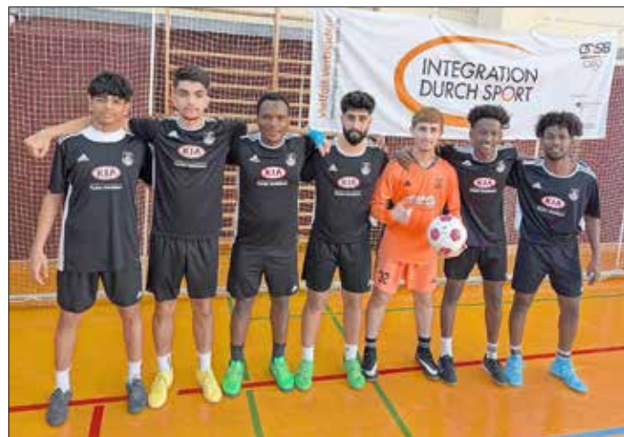
Die Gubener Mannschaft freut sich über die Platzierung.