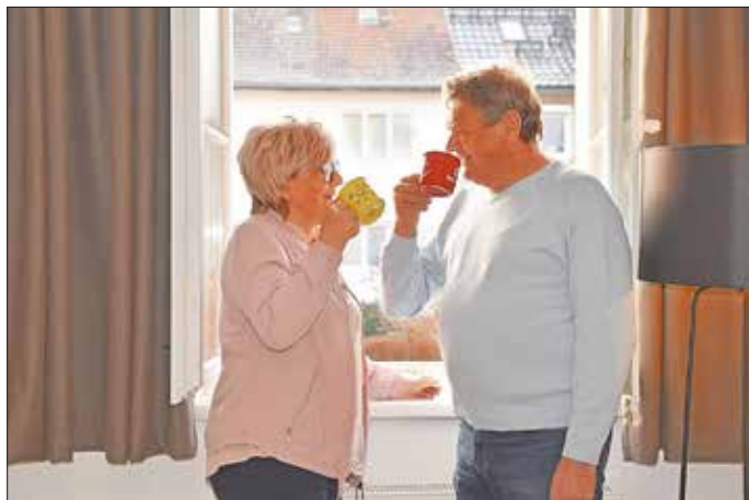
Aufgrund der großen Nachfrage startet das Projekt Probewohnen in die 2. Staffel.