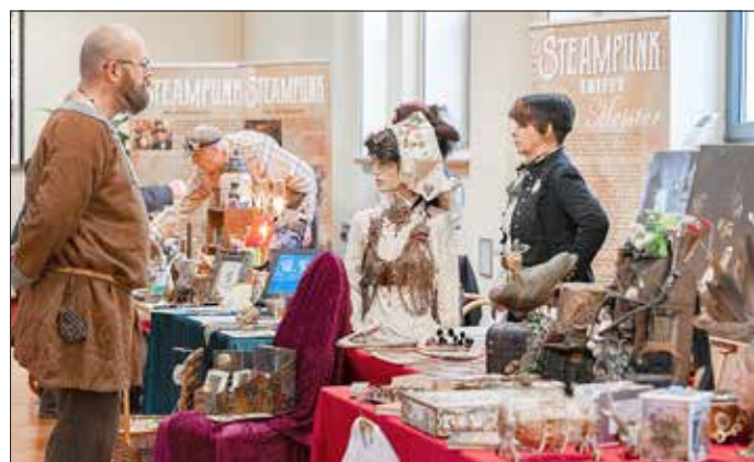
Großes Interesse am Stand von Steampunk.