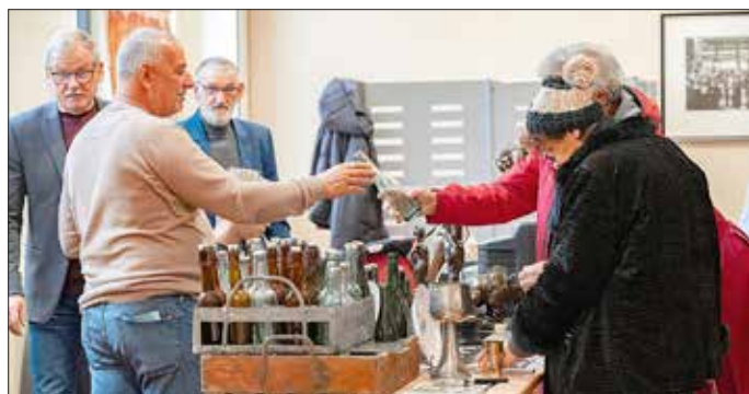
Historische Etiketten und regionale Handwerksarbeiten.

„Der Historienmarkt ist eine gute Möglichkeit, unsere Heimatgeschichte erlebbar zu machen ohne Anspruch auf Vollständigkeit und ohne belehrenden Duktus. Das große Interesse an den Fachvorträgen bestätigt, dass die Vergangenheit Gubens und der Niederlausitz weiterhin viele Menschen bewegt.“