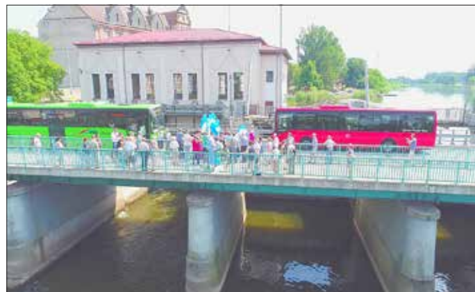
Eröffnung der Buslinie 895 im Jahr 2018 zum Frühlingsfest.