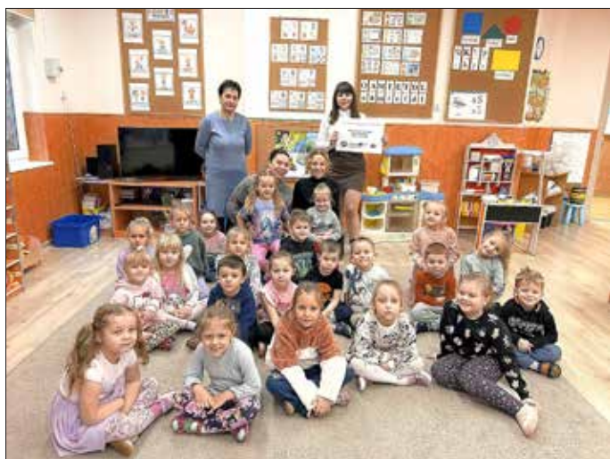
Sprachbrücke gestartet: Kinder der Gubiner Kita Nr. 2 beim Projektaufakt.

Die „Sprachbrücke Euroregion Spree-Neiße-Bober/Sprewa-Nysa-Bóbr“ nimmt weiter Fahrt auf!