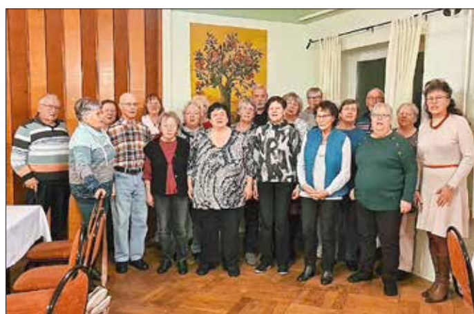
Chormitglieder bei ihrem Jahresabschlussstreffen.