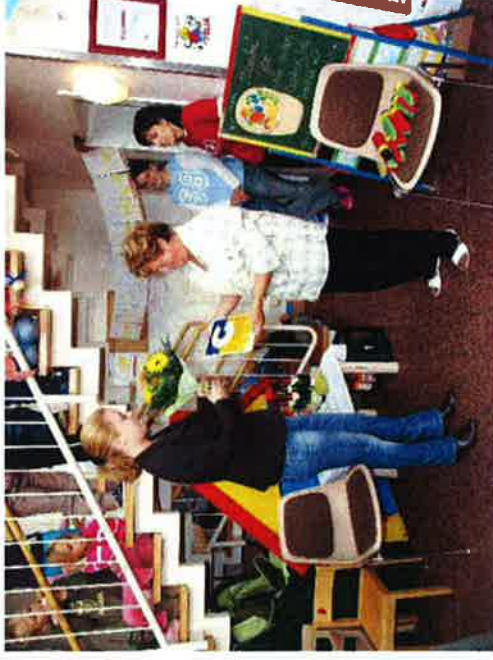
Kita Naemi-Wilke-Stift