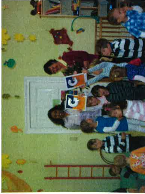
Kita Brummkreisel